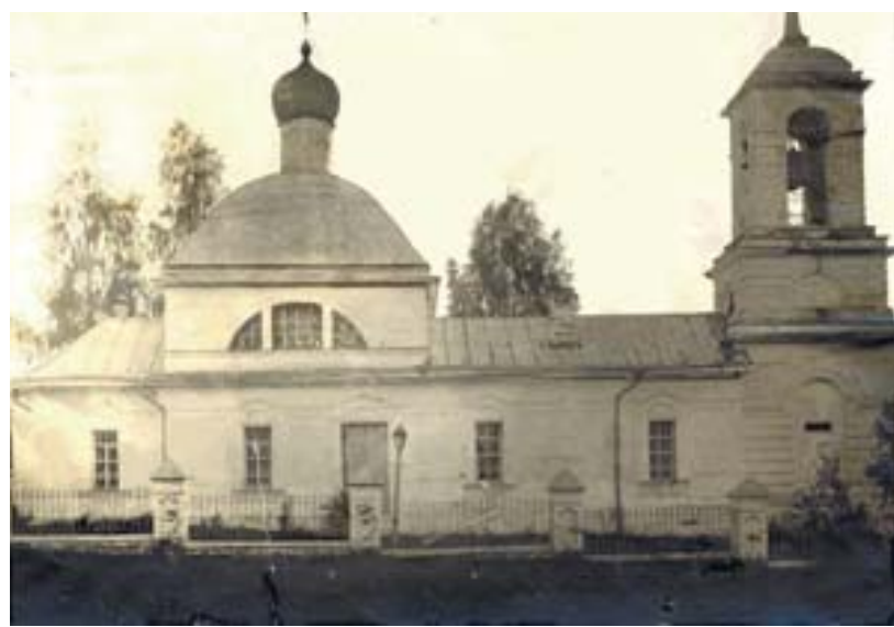
Храм Рождества Христова с.Филатово, начало XX века.

История села Филатово и окрестных мест по берегам небольшой речки Маглуши - притока реки Истра - уходит в глубину веков. Деревня Филатово известна по Писцовой книге Рузского уезда 1567-1569 годов. В этом же документе упомянуты также другие соседние селения: селцо Глебовское, погост Рождества Христова "на Мологощи" (так прежде называлась речка Маглуша), деревня Брыково (ныне поселок Красный), деревня Бока-