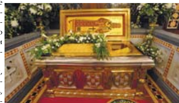
Рака с мощами Святителя Филарета в Храме Христа Спасителя (современное фото).

«Не забудет... не забудет ... не забудет ...». Увы, не сбылось это предсказание. Не долгов оказался век человеческой памяти. Но