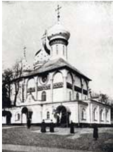
Святодуховская церковь с пристроенным справа Филаретовским приделом.

Благодаря его щедрости, здание приняло благолепный вид» (книга «Очерк жизнеописания Высокого» Цуриковым на собственное иждивение).