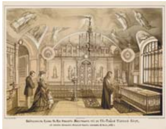
Внутри Филаретовского придела, справа гробница Святителя.