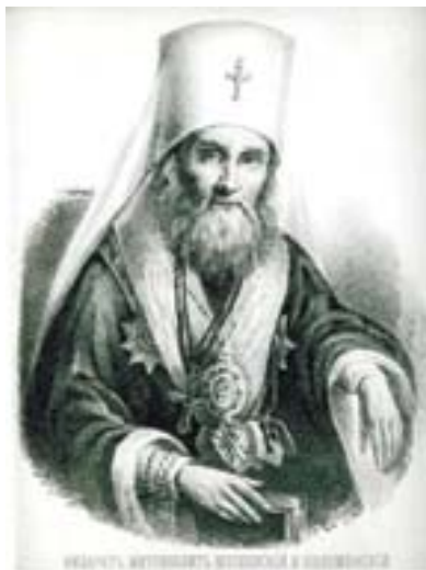
Портрет Митрополита Филарета (Дроздова).

Цуриков. ... Что связывало этих людей, что общего могло быть между ними, хоть и живших в одно время в XIX веке, но столь разных как по социальному положению, так и по возрасту (Владыка старше на 30 лет)?