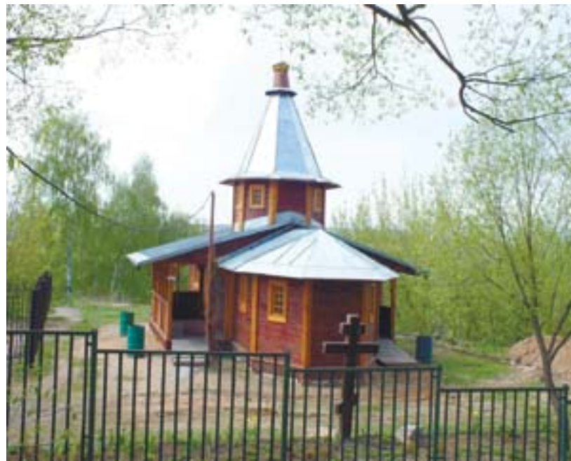
ДЕРЕВЯННЫЙ ВОЗНЕСЕНСКИЙ ХРАМ-ЧАСОВНЯ В ГОРОДЕ ИСТРА. 2012 ГОД.

в наличии имеются; на расстоянии двух километров имеются другие действующие церкви (так называемые Ильинская и Троицкая), Президиум Мособлисполкома постановляет: разрешить Истринскому РИКу церковь закрыть, а здание использовать в указанных целях». В этом документе прослеживается