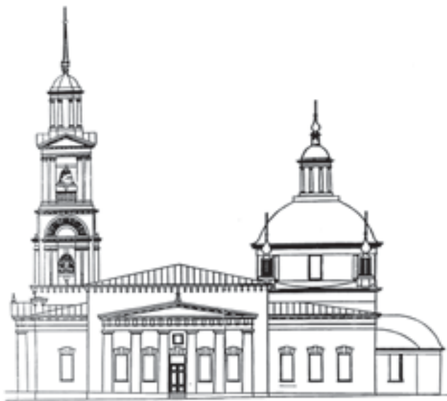
ПРОЕКТ РАСШИРЕНИЯ ХРАМА ВОЗНЕСЕНИЯ ГОСПОДНЯ. 1908 ГОД. ИЗ ФОНДОВ ЦИАМ.