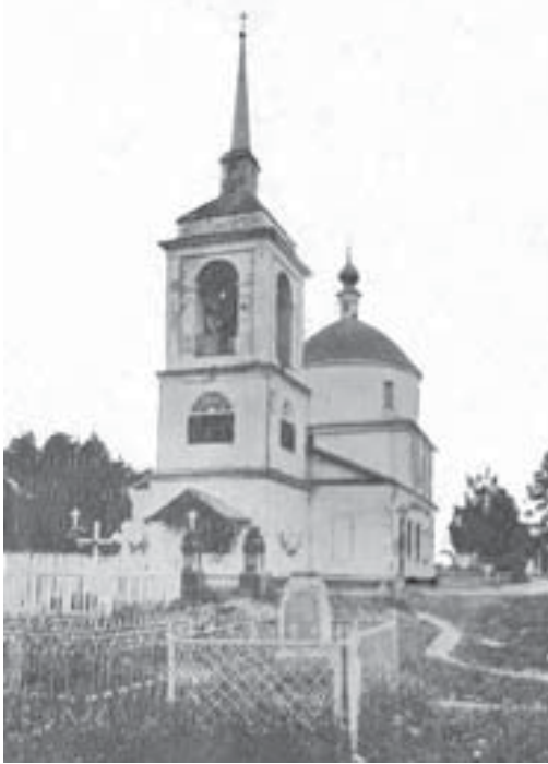
ХРАМ ВОЗНЕСЕНИЯ ГОСПОДНЯ В ГОРОДЕ ВОСКРЕСЕНСК (ДО РАСШИРЕНИЯ). ФОТО НАЧАЛА XX ВЕКА

нием начата, но не окончена за истощением в прежние годы церковной суммы. А как деревянная колокольня, находящаяся при прежней деревянной церкви, пришла уже в ветхость, и угрожает падением, а равно и суммы церковной на лицо