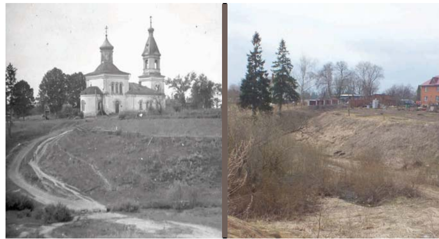
Слева храм Воздвижения Креста Господня в селе Телепнево. 1941 год. Справа современный снимок того же места.