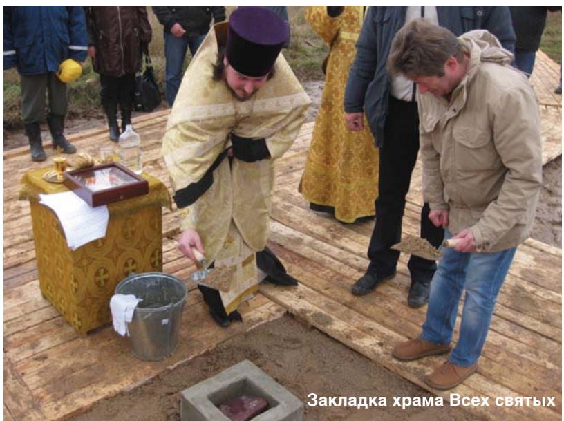
Закладка храма Всех святых

Мы были бы очень благодарны жителям района за сведения о местах некогда существовавших и несохранившихся ныне храмов. Информацию можно передать по контактному телефону 8–915–062–61–23. В настоящее время готовится переиздание книги «Святые Истринской земли». Интересные факты о несохранившихся храмах могут быть опубликованы в новом издании.