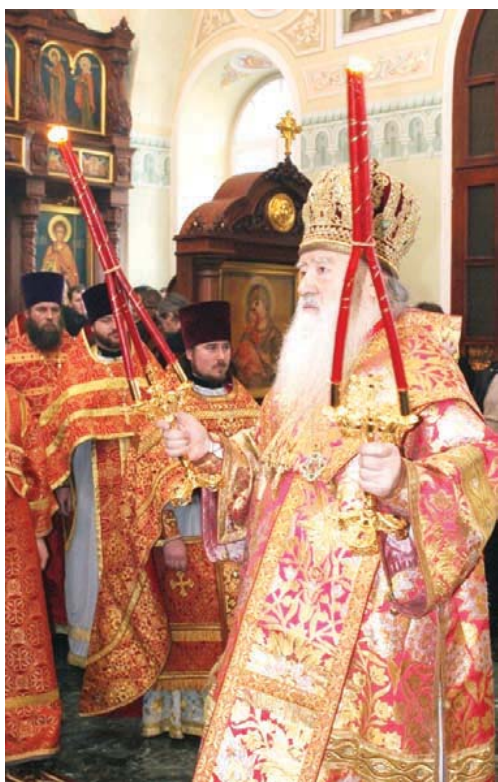
Продолжение. Начало на стр. 1

ИЗ РУК МИТРОПОЛИТА ЮВЕНАЛИЯ ПЕДАГОГИ ПОЛУЧИЛИ БЛАГОСЛОВЕННЫЕ ГРАМОТЫ