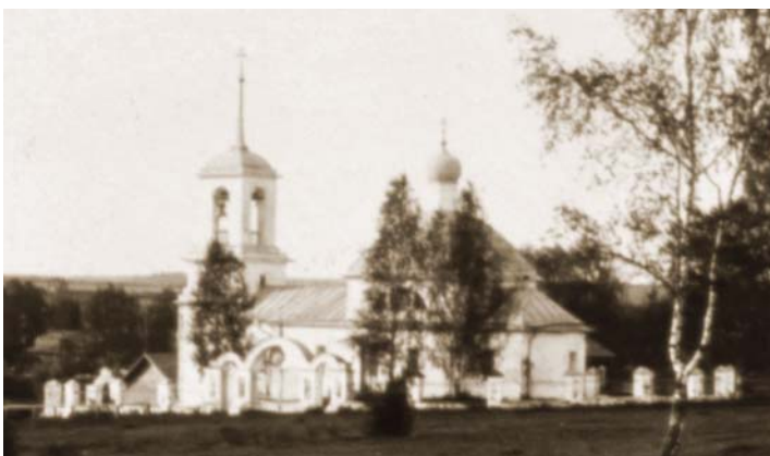
Христорождественский храм села Филатово. 1914 год