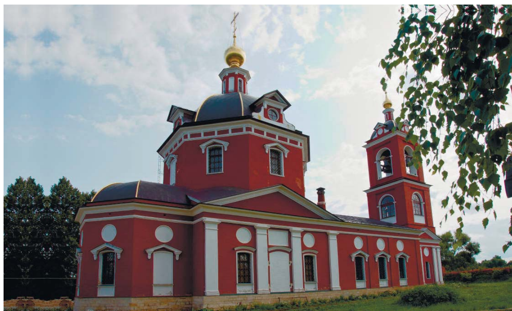
Борисоглебский храм села Куртнково

В июне 2015 года в Министерстве культуры Московской области было получено согласование проекта настенной живописи Борисоглебского храма, предоставленного художником В. В. Митрофановым. Ранее проект получил положительное заключение консультационно-экспертного совета при Епархиальном отделе по реставрации и строительству Москов-