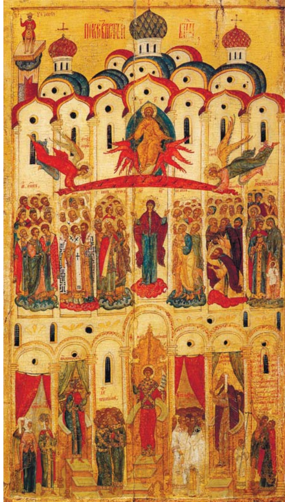
Покров Пресвятой Богородицы

чательно складывается к XIII веку. Существуют два иконографических типа изображения праздника –