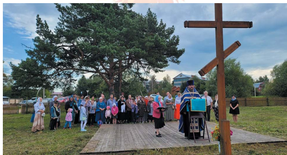
Молебен на месте утраченного Успенского храма