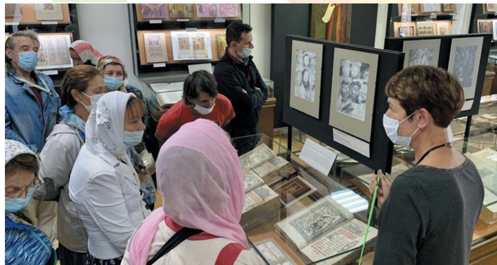
Паломники в музее Иосифо-Волоцкого монастыря

хожане никулинского храма посетили старинный Введенский храм в селе Спирово, где приложились к чтимому образу святителя Николая Чудотворца, и знаменитый Иосифо-Волоцкий монастырь.