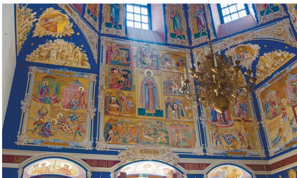
Фрагмент росписи основного четверика Борисоглебского храма

Первое богослужение в поновлённом Борисоглебском храме состоялось 6 августа этого года в день памяти святых благоверных князей стратотерпцев Бориса и Глеба.