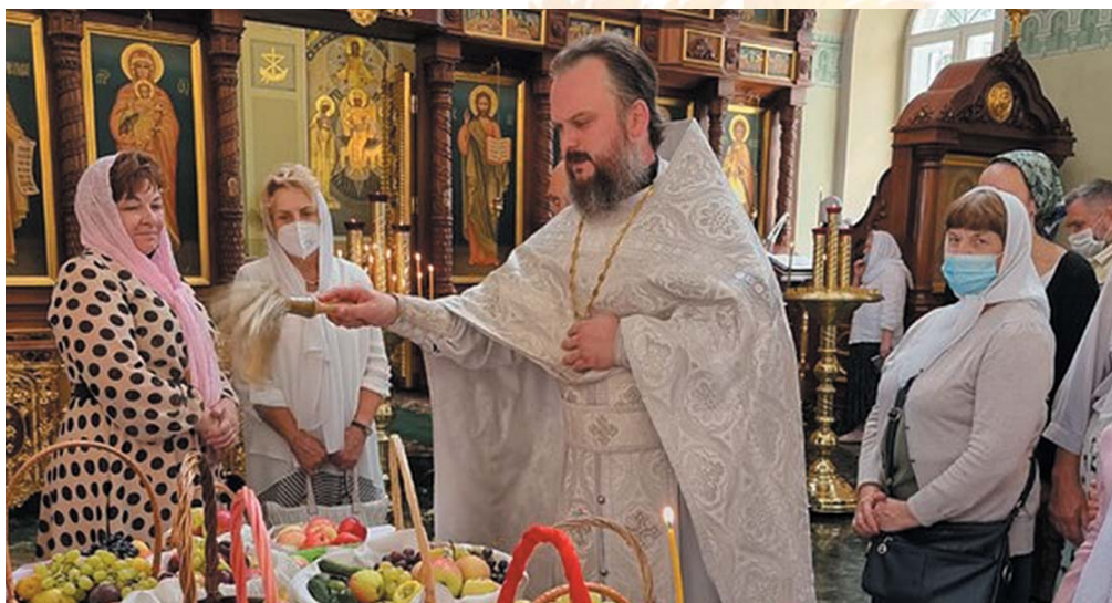
Чин освящения плодов нового урожая

обычно. После литургии священник читает молитву на освящение плодов нового урожая и на благословение лозы. Народная традиция именует день Преображения Господня Яблочным Спасом. Прихожане приносят с собой корзины с различными фруктами и овощами. На приходе Никольского храма села Мансурово ведётся разнообразная сельскохозяйственная деятельность, поэтому 19 августа для прихода – это еще и первые итоги сбора урожая сельскохозяйственных культур.