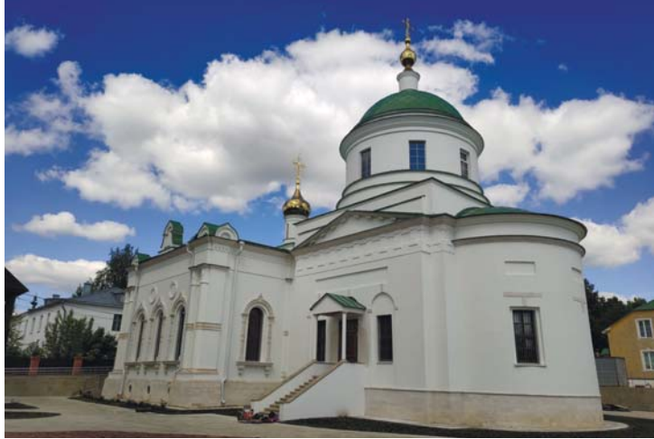
Петропавловский храм. Современное фото

Пол в настоящем храме лещадный, как в алтаре, так и в храме; в приделах же неодинаковый: в ал-