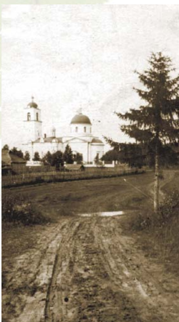
Петропавловский храм. Начало XX века

В 1992 году храм возвратили верующим. В 1993 году возобновились богослужения, начались восстановительные работы. Милостью Божией, в настоящее время здание храма полностью восстановлено. Ведутся работы по изготовлению иконостасов и благоустройство прилегающей территории.