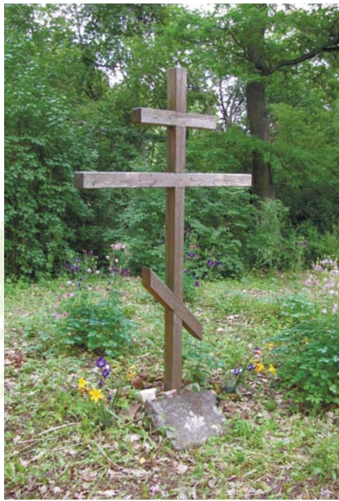
Крест на месте Троицкого храма на погосте Мушкино. 2011 год