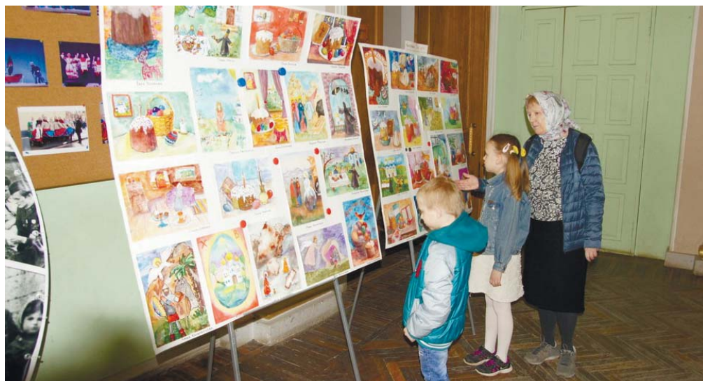
Выставка детских рисунков в холле Дедовского Дома культуры