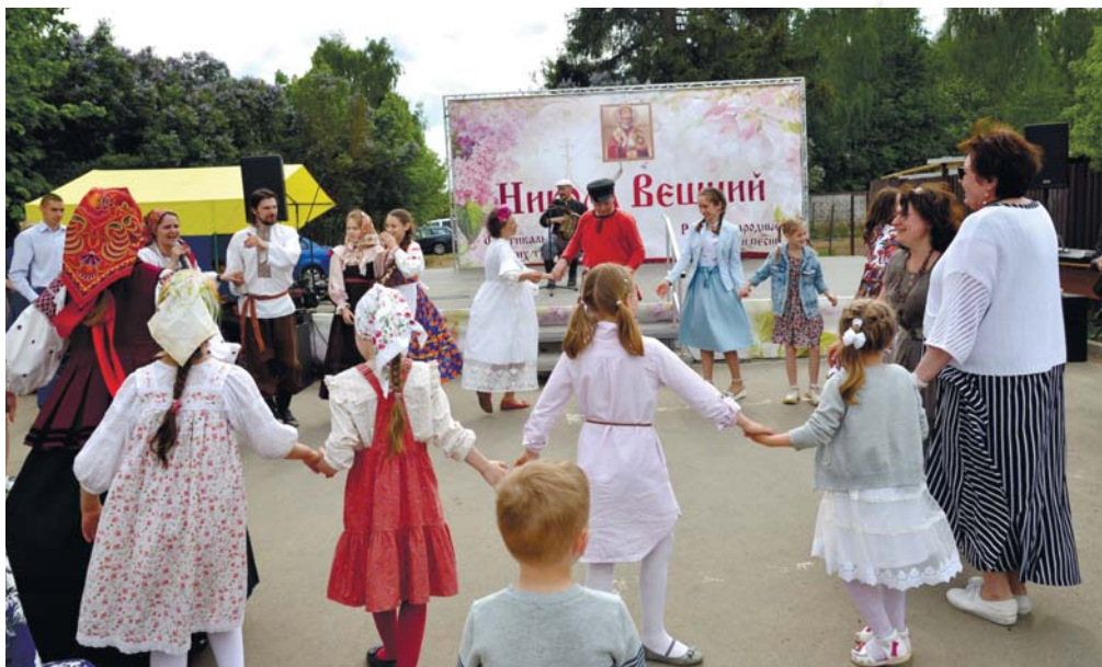
От мала до велика – все в общем хороводе