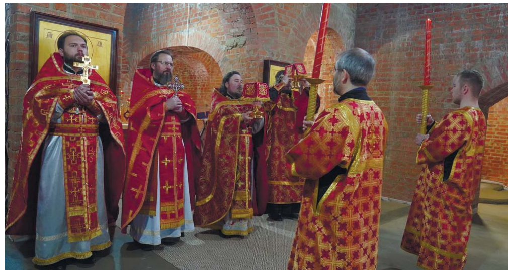
Праздничная литургия в строящемся Мироносицком храме

крестный ход, в котором вместе со взрослыми приняли участие юные прихожане и воспитанники воскресной школы. Дети несли в руках домашние иконы, перед которыми совершают домашние молитвы. Для всех гостей активными прихожанами было подготовлено угощение – каша из полевой кухни, а также выступления детского хора «Павушки» и детского коллектива Дома культуры «Северный».