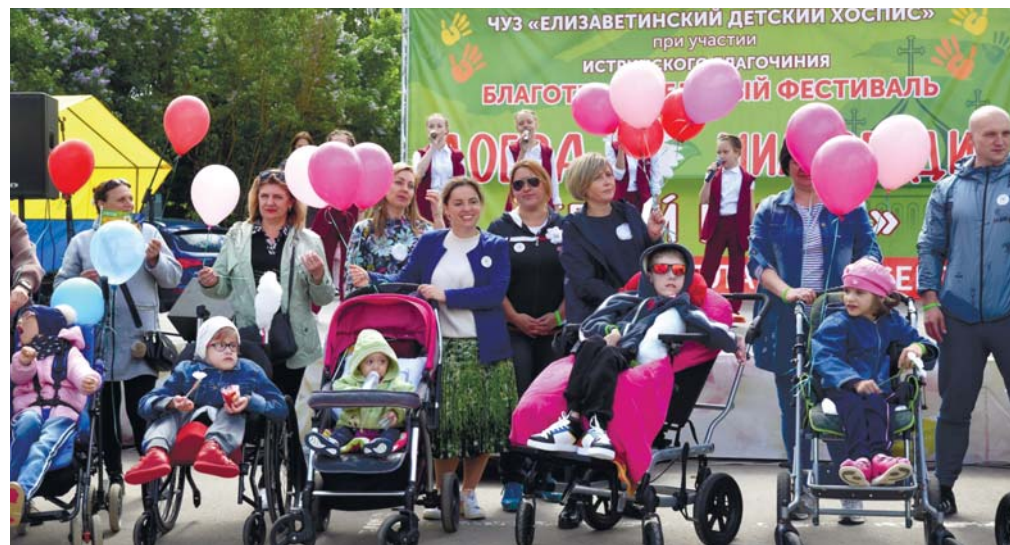
Воспитанники Елизаветинского хосписа на фестивале

ники хосписа. Для собравшихся работали благотворительные мастерские: палатки мастеров-ремесленников, плетение из лыка, кукольный театр и гончарная мастерская. Дети делали деревянные ложки, пекли торт, любовались гончарными изделиями и их изготовлением, плели «чудо-птичек». Гостей праздника ждал чай из самовара, полевая кухня и обширная концертная программа, порадовавшая всех своей душевной теплотой.