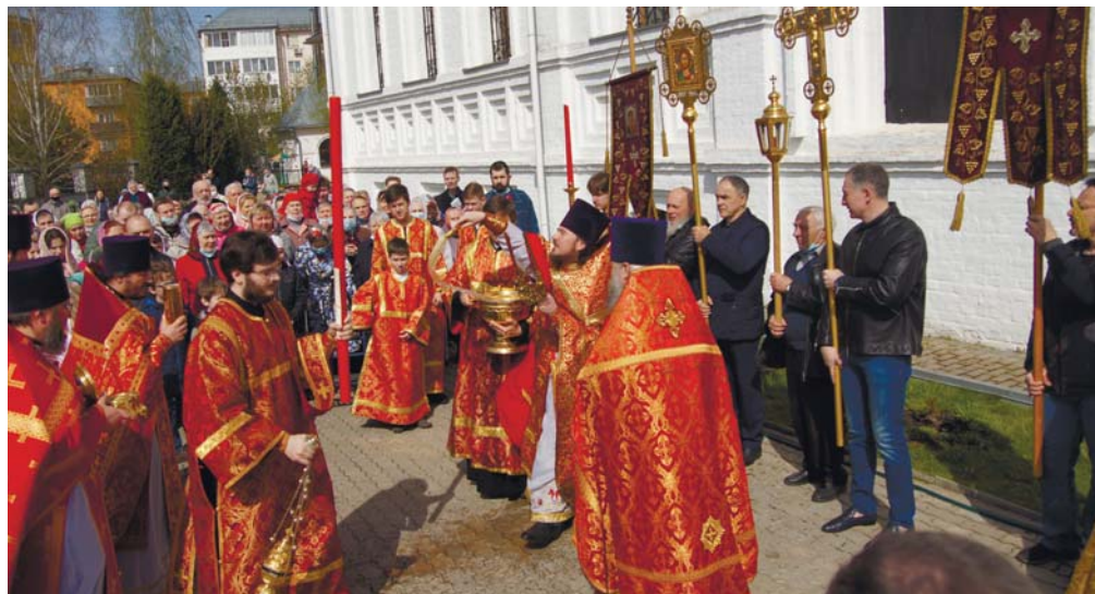
Праздничный крестный ход вокруг Георгиевского храма