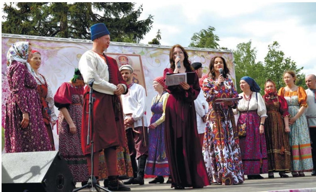
Одни из участников концертной программы фестиваля

Гостей праздника ждал чай из самовара, благотворительная полевая кухня и храмовая выпечка и обширная концертная программа, проникнутая любовью к Богу и самому чтимому в России святому, Николаю Чудотворцу. На празднике гости вместе с выступающими коллективами исполнили традиционные русские народные и казачьи песни, вместе танцевали и водили хороводы.