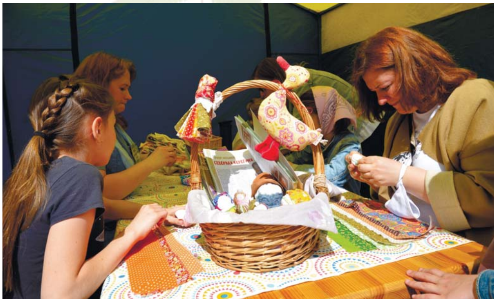
Творческие мастерские для гостей любого возраста