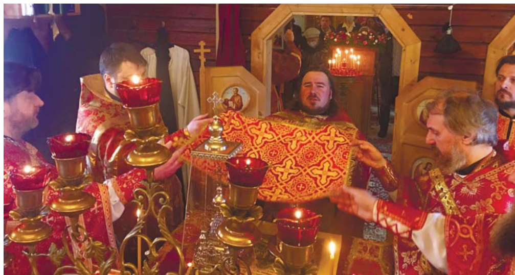
Соборная Божественная литургия в Вознесенском храме

чании литургии по сложившейся традиции был совершен уставной крестный ход. Все три Истринские новомученицы были арестованы в январе 1938 года по ложным доносам, обвинены в контрреволюционной деятельности, расстреляны 5 февраля 1938 года и погребены в безвестной общей могиле на полигоне Бутово под Москвой. В феврале 2001 года решением Священного Синода Русской Православной Церкви они включены в Собор новомучеников и исповедников Российских от Московской епархии.