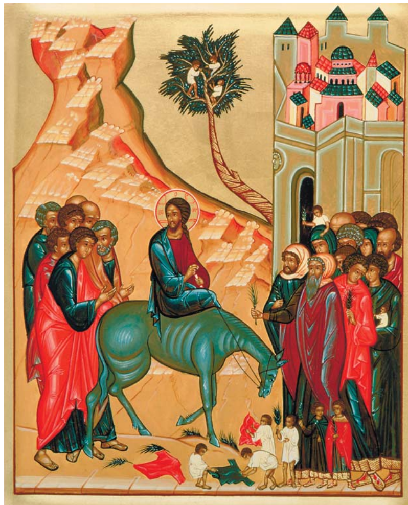
Икона «Вход Господень в Иерусалим»

Сейчас Спаситель сойдёт с осла и как простой паломник войдёт в царственный град Иерусалим. А за стенами Его ждут отречения учеников, отступничество народа и страдания. Многие тревожат душу Господа. Но Он неуклонно следует к воротам Иерусалима: час настал, и Сын Божий исполнит великую волю Отца, отдав жизнь во имя искупления грехов человеческих. Своим распятием на Кресте Он победит смерть и откроет всему живому путь в Царствие Небесное.