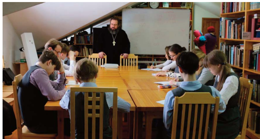
Рассказ о новомучениках и исповедниках Истринской земли

щимся об основных временных этапах гонений на Церковь и верующих после 1917 года. Отдельно священник уделит внимание житиям новомучеников Истринской земли и даже принёс с собой на встречу копии архивных документов – следственных дел святых исповедников. Святые новомученики Церкви Русской Истринской земли, молитесь Богу о нас!