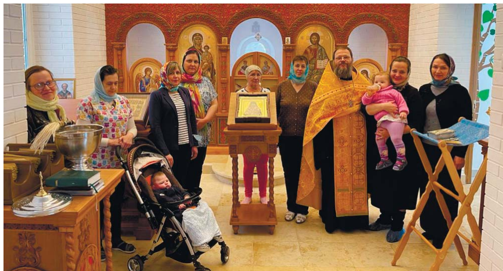
После молебна у образа святителя Луки Крымского