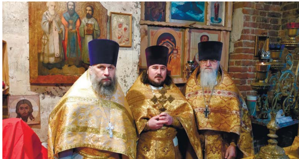
Участники рабочего совещания в Вознесенском храме