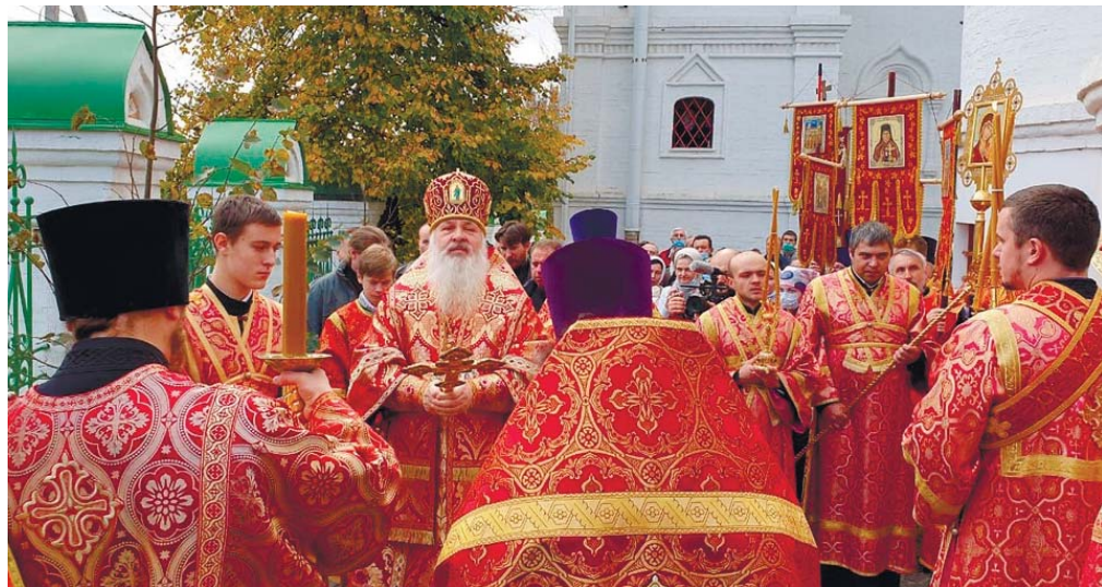
Праздничный крестный ход вокруг Никольского храма

Вячеслава Коновалова и духовенства благочиния. По окончании литургии состоялся уставной крестный ход и славление новомученикам. По завершении богослужения епископ Тихон обратился с архиерейским словом и передал собравшимся благословение митрополита Ювеналия. Благословенными грамотами были отмечены особо потрудившиеся на благо Истринского благочиния.