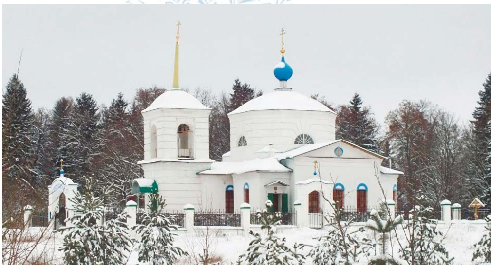
Покровский храм села Огниково

Особенно рады мы первому снегу, когда осенняя земля преобразается, убеляется. Где же сегодня можно видеть такие картины тихой белизны? Ну, конечно, там, где меньше суеты и движения, там, где жизнь течёт спокойно и неторопливо, вдали от города. Город уже давно стал далёк от Неба в своём машинном ритме. Здесь вся поверхность земли подчинена как раз обратному – борьбе со снегом. Его травят, скребут, поливают солёными растворами, вывозят с дорог и тротуаров, чтобы дать проехать миллионам машин и пройти уйме людей. А вдали от больших городов есть местность, которая называется сельской. И как же здесь живётся по-другому! Вот среди белых заснеженных лугов, среди укромных убеждённых лесов стоит сельский храм. Его купола в снегу. Вся земля бела,