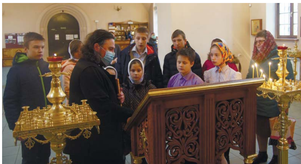
Воспитанники Дедовской школы-интерната в Георгиевском храме