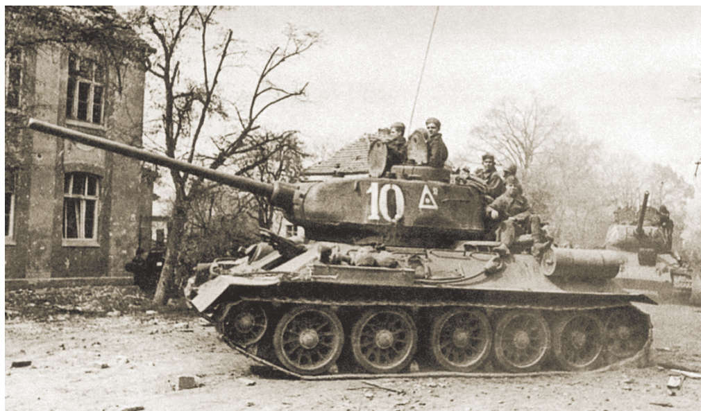
Танк Т-34-85 на одной из улиц Берлина. 1945 год