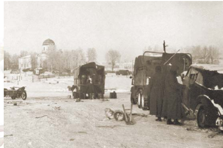
Фашистские войска в селе Новопетровское на фоне Петропавловского храма. 1941 год

дящие советские войска, и отступающие затем фашисты сжигали всё, что успевали. Тем более удивительно, каким чудом уцелел деревянный Троицкий храм в посёлке Троицкий, построенный в XVII веке. Во время боя, по словам очевидцев, «огненные нити снарядов пронеслись над [деревянным] храмом, не задев его». Удивительно, но обстрел, который продолжался несколько часов, не принёс храму почти никакого разрушения, лишь частично задела главный купол святыни и немного