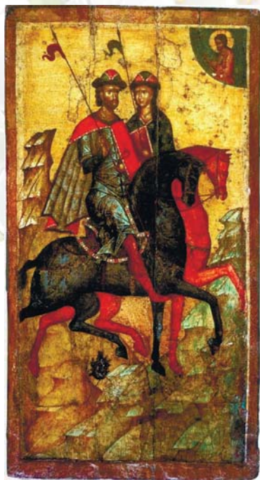
Князья-страстотерпцы Борис и Глеб

Ещё при жизни отца святой Борис получил в удел Ростов. Управляя своим княжеством, он проявил мудрость и кропотливость, заботясь о насаждении православной веры и утверждении благочестивого образа жизни среди подданных. Молодой князь прославился также как храбрый и искусный воин. Незадолго до своей смерти великий князь Владимир призвал Бориса в Киев и направил его с войском против печенегов. Когда