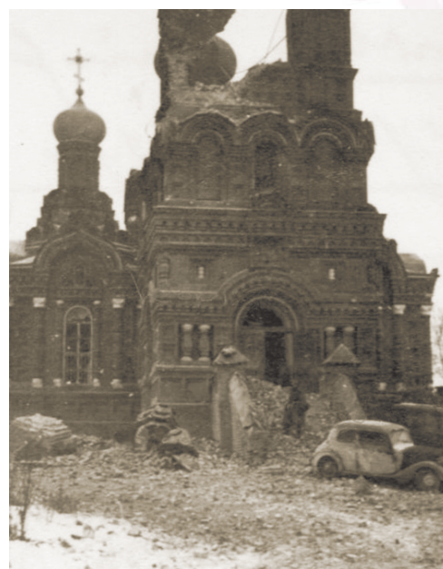
Храм Крестовоздвижения Господня в селе Дарна. 1941 год

после чего отправился на командный пункт 258-го стрелкового полка, находившийся в деревне Кашино. По прибытии на место оказалось, что полк отрезан, а к самой деревне подходит пехота врага. Под миномётным огнём, через минное поле, а затем и по тонкому льду пришлось журналисту и офицерам прорываться к своим. После прихода в деревню штабисты и корреспонденты были размещены в землянке. Все были очень уставшими. Устроились около печки, кто-то начал играть на гармонии, чтобы снять напряжение. Журналист Сурков стал делать наброски для репортажа, но получились стихи. Ночью он вернулся в Москву, где и закончил своё знаменитое стихотворение «В землянке», вскоре ставшее песней с лёгкой руки композитора Константина Яковлевича Листова. В мае 1999 года в деревне Кашино был уста-