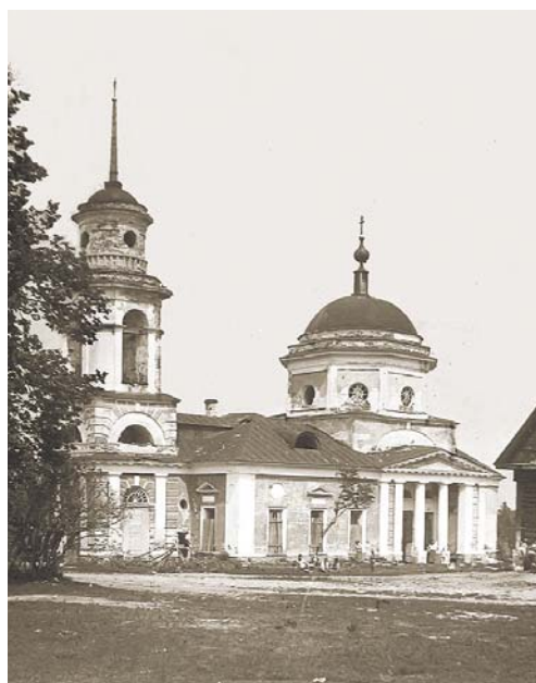
Храм Рождества Богородицы в селе Александрово. 1941 год

Уже 75 лет отделяют нас от Победы в Великой Отечественной войне. В гигантской схватке с фашизмом исключительную роль сыграла битва под Москвой. На полях Подмосковья, в том числе и на Истринской земле, в 1941 году впервые в истории был нанесён сокрушительный удар фашистской армии. В буквальном смысле «воевать» приходилось даже храмам, и часть из них были уничтожены именно в 1941 году, когда немцы всеми силами рвались к Москве.