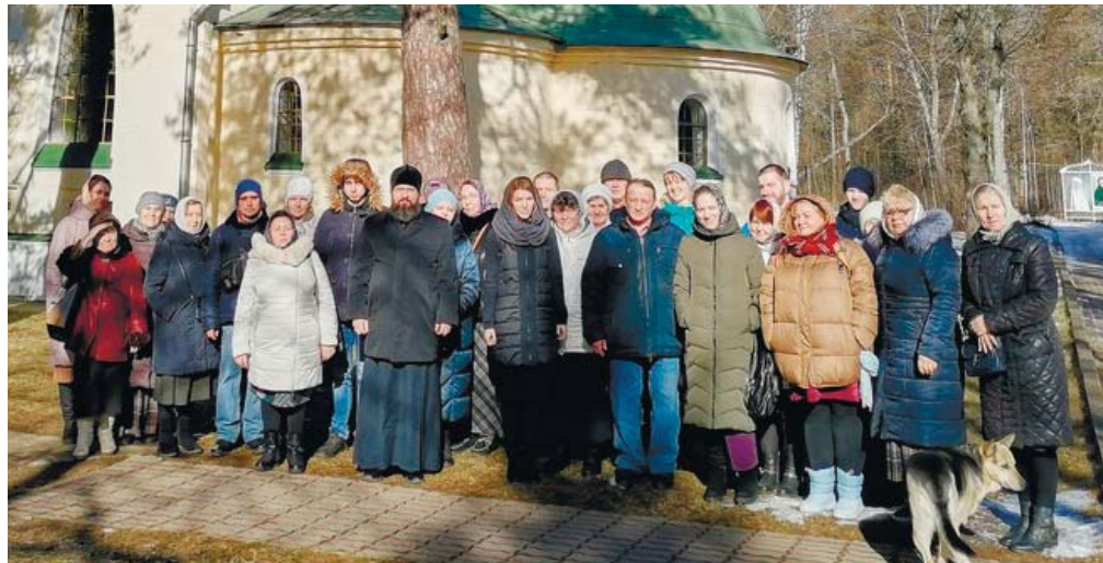
Паломники у Серафимо-Знаменского скита