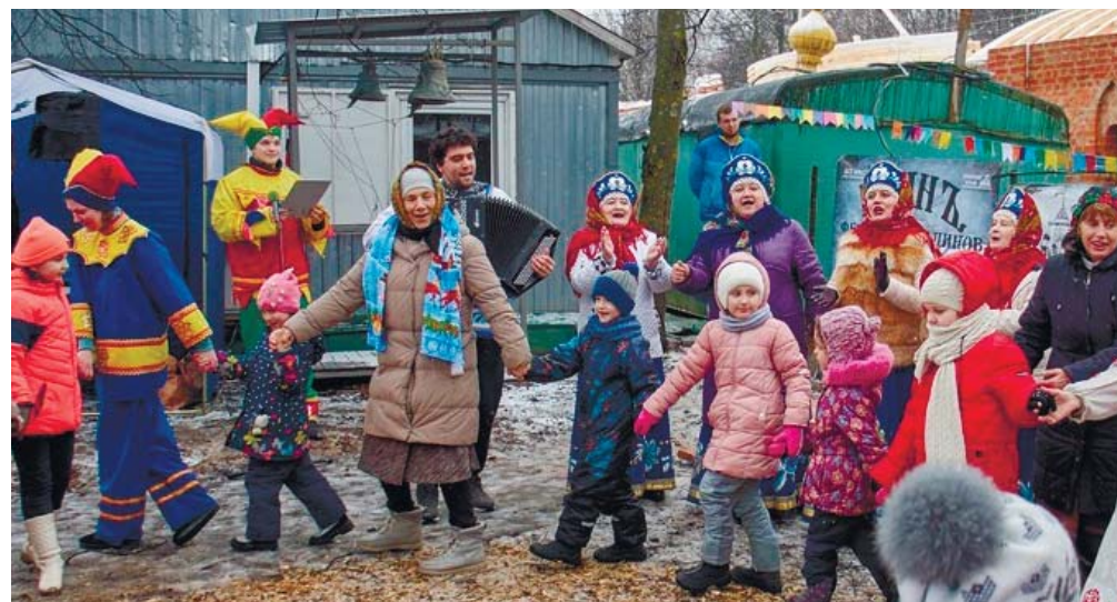
Праздничный хоровод у строящегося Мироносицкого храма

защитника Отечества, поэтому с особым вниманием гости приветствовали участников молодецких забав. Мужчины соревновались в поднятии гирь, перетягивании каната, приготовлении блинов. Прихожане и гости праздника угощались блинами, горячим чаем, дружески общались, плясали. А в воскресной школе прошёл мастер-класс по росписи пряников.