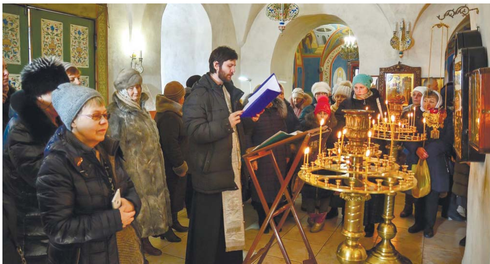
Молебен у чудотворного образа Божией Матери

«Неупиваемая Чаша», приложиться к мощам преподобного Афанасия и к другим святыням. Во Владычнем монастыре священником Николаем был отслужен молебен перед мощами преподобного Варлаама Серпуховского. В Давидовой пустыни паломники также смогли приложиться к святыням монастыря и отслужить молебен у мощей преподобного Давида Вознесенского.