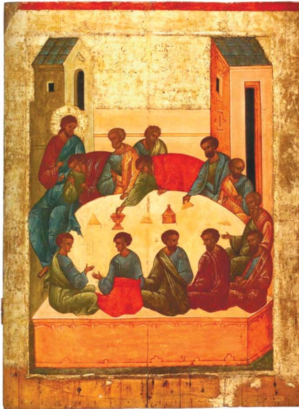
Икона «Тайная вечеря»

находиться среди избранных учеников Спасителя, поскольку был призван на апостольское служение значительно позже. Изображая апостола Павла в числе двенадцати в таких иконах как «Причастие апостолов», «Вознесение Господне» и «Сошествие Святого Духа», иконописцы выражали вневременной характер этих событий.