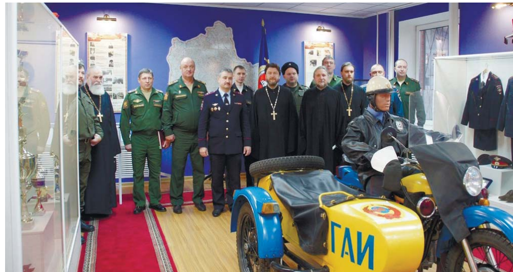
Участники встречи в Музее полиции в Истре

взаимодействию с вооруженными силами и правоохранительными органами в Истринском благочинии и духовенства округа. В ходе мероприятия были подписаны планы взаимодействия на будущий 2020 год. Далее всем присутствующим было предложено посетить исторический Музей полиции. В завершении встречи собравшиеся обсудили вопросы расширения дальнейшего взаимодействия.