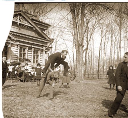
Одна из стереофотографий на стекле из архива Григория Шпейера