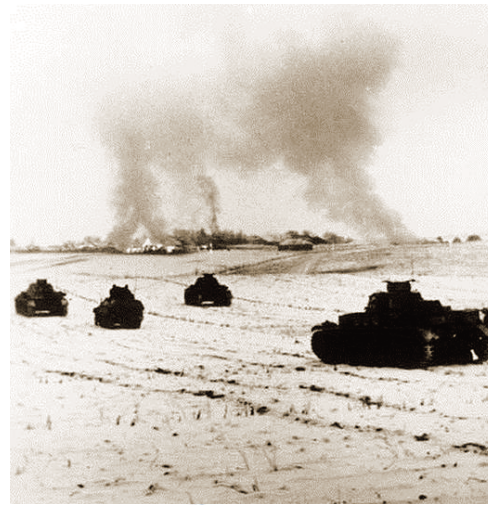
Атака немецких танков на подступах к Истре. 1941 год

дал Кенигсберг, а затем участвовал в войне с Японией и вернулся в Филатово лишь в феврале 1946 года, весь израненный и с наградами.