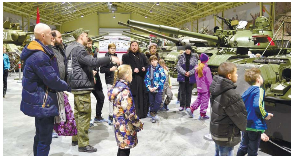
Воспитанники воскресной школы в Музее отечественной военной истории