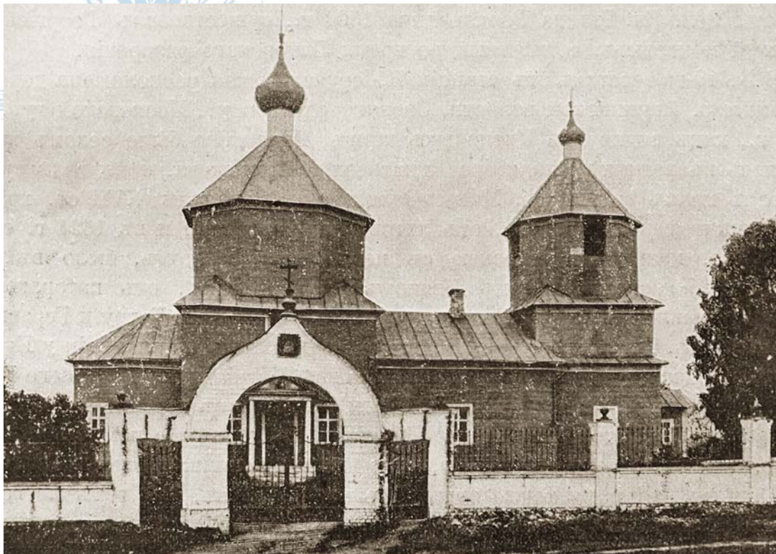
Вид Преображенской церкви с севера. 1909 год

кою, с таковым же под ним яблоком, на церкви крыша железная, окрашена медянкою, при ней колокольня деревянная, тож покрыта железом, окрашена медянкою, с таковым же крестом и яблоком, она церковь обнесена кругом железною оградой».