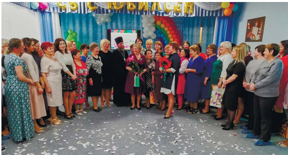
Сотрудники детского сада с многочисленными гостями праздника

своими глазами увидели боевые машины, сохранившиеся со времён Великой Отечественной войны и бережно восстановленные в музейных мастерских, а также ознакомились с боевой техникой, стоящей на вооружении в Российской армии в настоящее время.