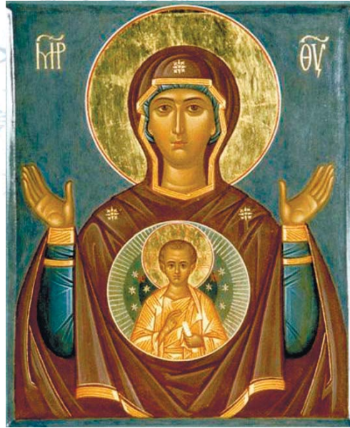
Икона Богородицы «Знамение»

ванную историю. Упоминания о ней содержат письменные источники – Новгородская Первая летопись и «Слово о Знамени святыя Богородица в лето 6677-е (1169)», составленные в XIV-XV веках на основе ранних текстов.