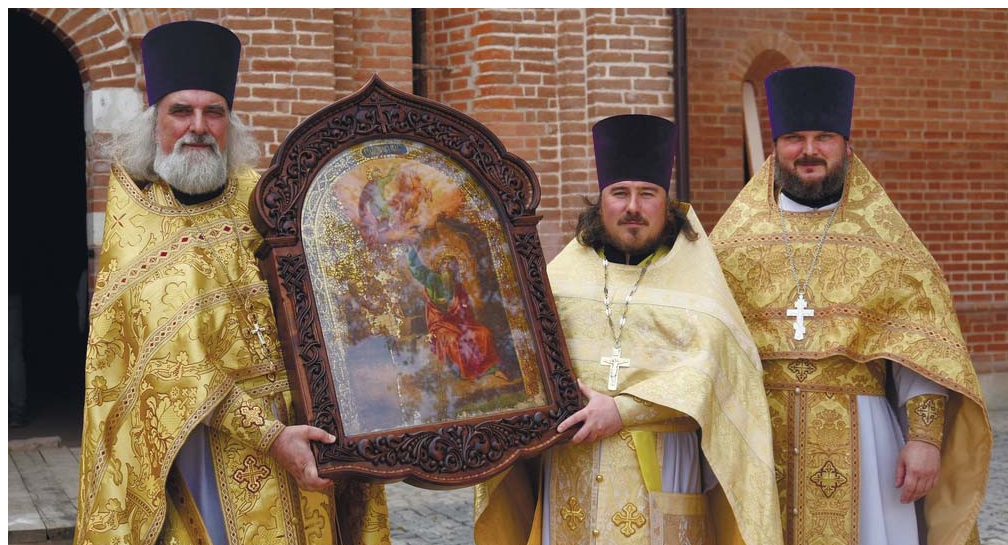
Священнослужители с отреставрированной иконой пророка Илии