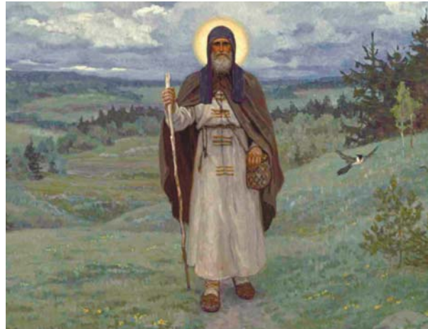
Преподобный Сергей. Картина С. Н. Ефошкина

нием Святого Духа совершаются деяния Поместных Соборов Русской Церкви. В обители пребывает святейший патриарх Московский и всея Руси, который по установившемуся правилу является «Свято-Троицкой Сергиевой Лавры священноархимандритом».