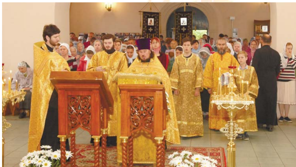
Молебен святым Петру и Февронии в Георгиевском храме. 2018 год

Пример такого блаженного упокоения святых Петра и Февронии утверждает нас в правильности слов святителя Иоанна Златоуста, полагавшего, что «в будущем веке все верные супруги безбоязненно встретятся и будут пребывать вечно со Христом и друг с другом в великой радости». И это не случайно, потому что «любовь изменяет само существо вещей», – утверждал святитель. А апостол Павел писал, что «любовь никогда не перестанет, хотя и пророчества прекратятся, и языки умолкнут, и знание упразднится!» Своей жизнью Пётр и Феврония воплотили на земле образ небесного брака – полное единение супругов.