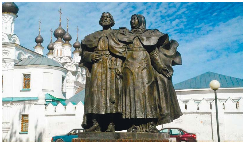
Памятник благоверным супругам Петру и Февронии в Муроме. 2015 год

Ежегодно 8 июля Православная Церковь отмечает день памяти святых благоверных супругов Петра и Февронии Муромских. С 2008 года этот день стал Днём семьи, любви и верности, и количество желающих вступить в брак в этот день увеличилось. Но так как этот праздник всегда приходится на Петров пост, то совершать таинство венчания невозможно. В 2012 году решением Священного Синода было установлено так же совершать службу святым Петру и Февронии Муромским в воскресный день, предшествующий 19 сентября в воспоминание перенесения их честных мощей в 1992 году. В этом году это 15 сентября.