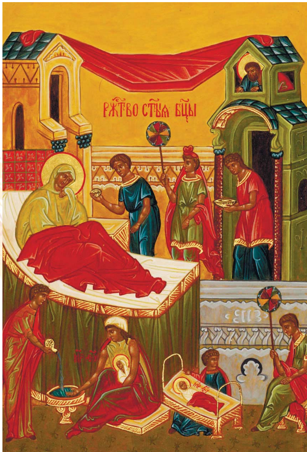
Икона «Рождество Пресвятой Богородицы»

Прославляя Рождество Пречистой Богородицы, разрешившее от неплодства её родителей, мы