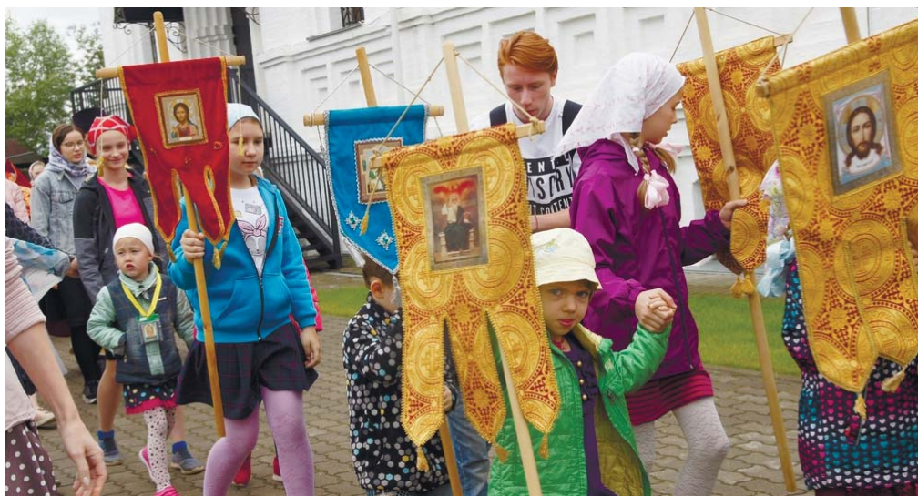
Традиционный детский крестный ход вокруг Георгиевского храма

состоялся детский крестный ход, участниками которого стали юные прихожане, которые несли изготовленные на уроках в воскресной школе хоругви, а также иконы, перед которыми они совершают домашнюю молитву. В завершение праздника все прихожане были приглашены на трапезу, устроенную на площади перед культурным центром храма.