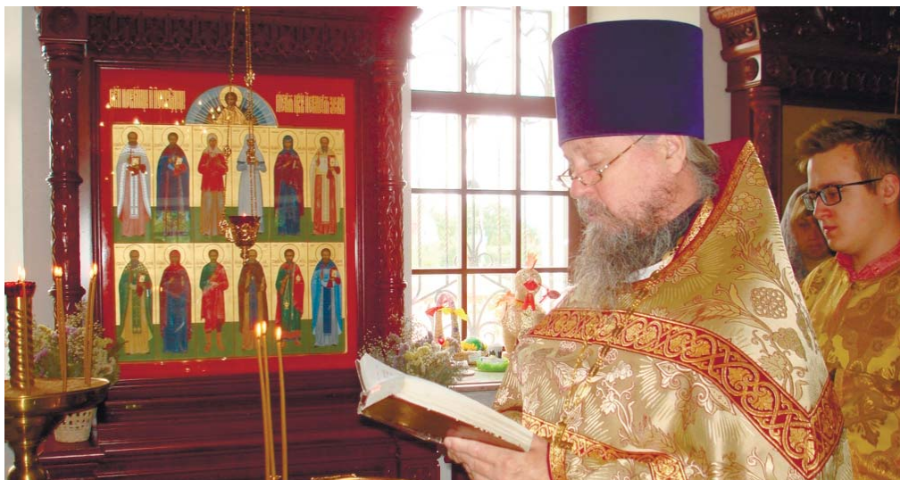
Чин освящения иконы новомучеников Истринской земли

Церкви Русской Истринской земли помещена в резной киот, в который вставлена копия Туринской плащаницы. Сегодня важно помнить о подвиге новомучеников. Истринские мученики засвидетельствовали свою верность Христу до смерти. Каждый из них олицетворяет собой символ Православной Руси, который учит нас строгой вере и служит для нас спасительным уроком.