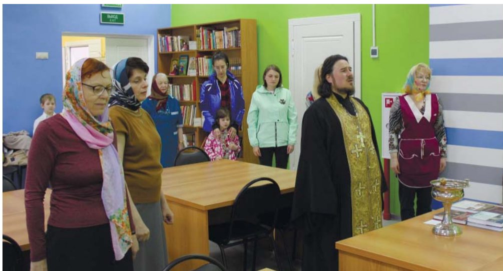
Молебен с сотрудниками Дедовской городской библиотеки

окопчил помещения святой водой. Также священник побеседовал с сотрудниками о необходимости духовно-нравственного воспитания детей и молодежи, а в конце встречи подарил библиотеке Библию и другие душеполезные книги.