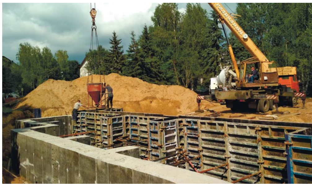
Заливка фундамента Мироносицкого храма. 2018 год

По окончании состоялся крестный ход, в котором приняли участие юные прихожане, принешие свои домашние иконы. В конце крестного хода была прочитана молитва на начало строительных работ, и священнослужители окропили святой водой место будущего строительства и материалы: кирпич, белый камень, арматуру – всё, что будет скоро положено в основу строящегося храма.