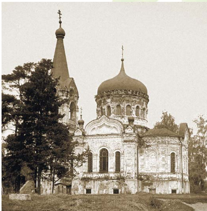
Троицкий храм села Троицкое. Середина XX века