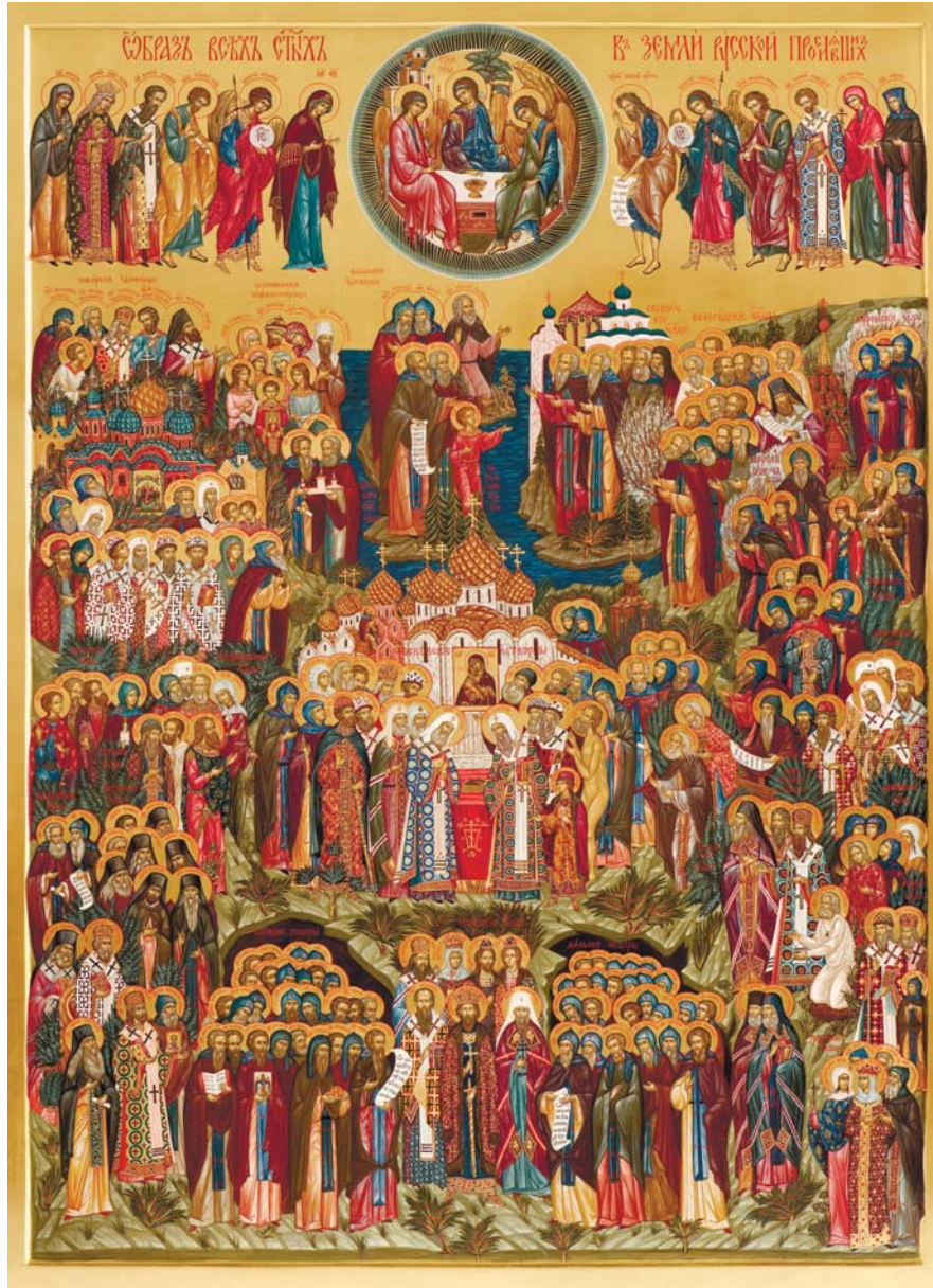
Собор всех святых, в земле Русской просиявших

Святитель Афанасий задумал круговую композицию иконы, где группы святых должны были располагаться по ходу солнца, последовательно отображая юг, запад, север и восток России. Пополненная новым рядом круговая композиция иконы стала более сложной, однако в ней сохранился образ совершенного единства, символом которого является круг. Видно, как с двух сторон от центра поднимаются ветви русской святости: слева расположены сонмы подвижников,