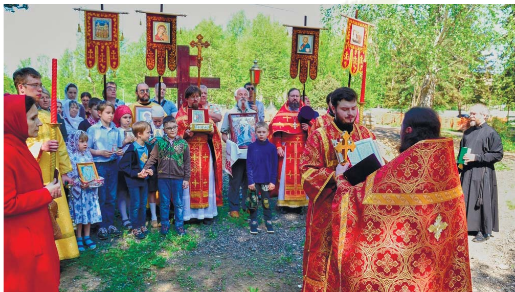
Молебен на начало строительных работ. 2019 год

Со дня закладки храма в сквере напротив школы имени Крупской возвышался деревянный крест. У креста каждое воскресенье совершались молебны с акафистом Божией Матери, а в октябре 2005 года был поставлен деревянный вагончик, заботливо переоборудованный прихожанами под храм. Усердием приходской общины и духовенства храма в ноябре 2008 года рядом с храмом-вагончиком был установлен щитовой блок. С февраля 2009 года все богослужения совершаются в нём. Это стало радостным событием для прихода и отрадой всем верующим истринцам. В 2018 году начались работы по возведению основного каменного здания Мироносицкого храма. Призываем всех читателей поддержать благое дело строительства Дома Божия.