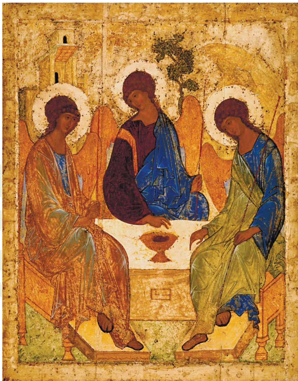
Троица. Андрей Рублёв. Россия. XV век

Люди не мудрее и не милостивее Бога. А если и они умеют снабжать