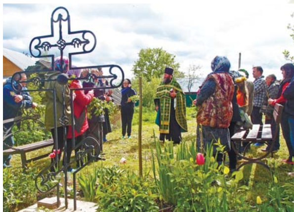
Молебен у креста в Назарово. 2017 год

Некоторые сведения об уничтоженном храме в селе Назарово удалось узнать у местных старожилов, однако в некоторых высказываниях их слова противоречивы.