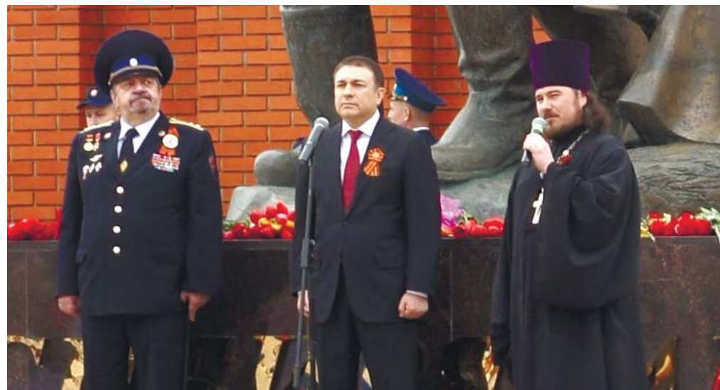
Торжественное открытие праздничного мероприятия

нов, после чего состоялся праздник, подготовленный силами работников культуры городского округа. После возложения цветов и венков к памятнику воинам, была совершена лития на могиле дважды Героя Советского Союза генерала армии А. П. Белобородова по всем вождям и воинам, на поле брани убиенным. В этот же день, по сложившейся многолетней традиции, из посёлка Снегири до Ленино-Снегиревского мемориального комплекса прошли участники акции «Бессмертный полк». Шествие возглавил губернатор Московской области А. Ю. Воробьев.