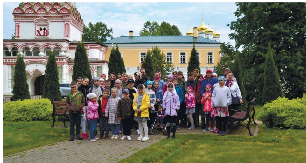
Паломники из Истры в Иосифо-Волоцком монастыре

ным, просветительским и хозяйственным центром. Сегодня здесь работает первый и единственный в России музей Библии, где представлено уникальное собрание рукописных и старопечатных книг. Истринские паломники побывали на экскурсии в музее, а также на обзорном знакомстве с историей монастыря и его святынями, приложились к чудотворному образу иконы Богородицы «Взыскание погибших», мощам святого Иосифа Волоцкого и другим святыням.