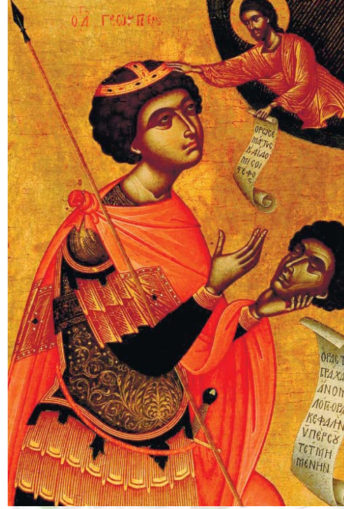
Святой Георгий с отсечённой головой в руках. Крит. XV век

праведности. И обувши ноги в готовность благовествовать мир; а паче всего возьми щит веры... и шлем спасения возьмите, и меч духовный, который есть Слово Божие», – пишет святой апостол Павел (Еф. 6:14-17).