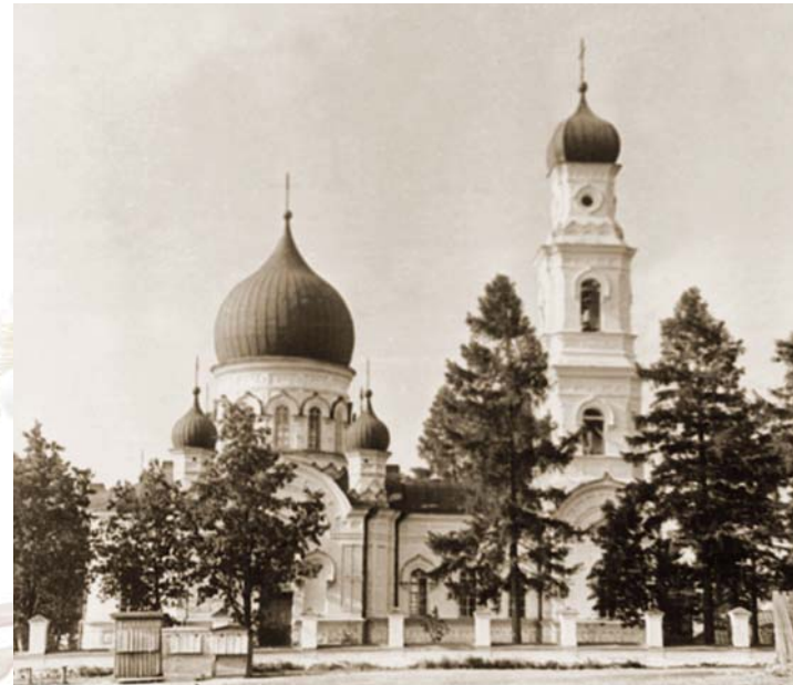
Михайловский храм города Кушва. Начало 1950-х годов

мером и любовью формировали внутренний мир будущих пастырей! Братские молебны ранним утром у раки преподобного Сергия, пение семинарского хора за лаврскими богослужениями, назидания, проповеди братии, исповеди у старцев – всё это по крупицам складывалось в своём сердце и пронёс через десятилетия своего пастырского служения».