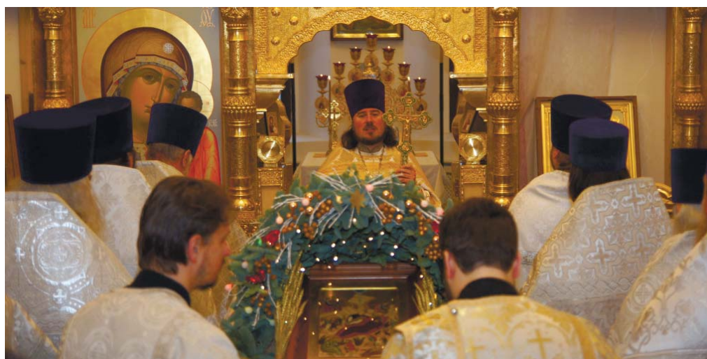
Соборное богослужение духовенства