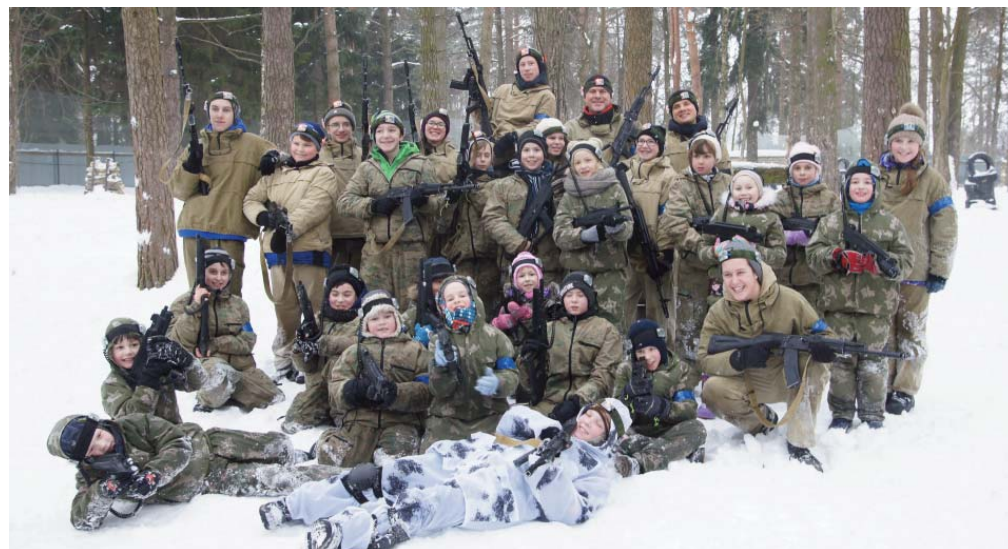
Фото на память после завершения игры