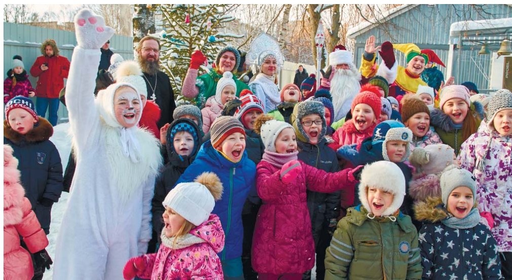
Праздничное настроение во время уличных игр

праздник, посвящённый Рождеству Христову. Дети подготовили небольшое представление, рассказывающее евангельскую историю рождения Богомладенца, читали стихи и пели песни. А на улице их уже ждал сюрприз. Игровое представление с танцами и конкурсами подготовили друзья прихода – театр массовых представлений «Артист». Сладкие подарки, собранные стараниями прихожан Мироносицкого храма, детям вручили сам Дед Мороз и Снегурочка. После игр детей угостили горячим чаем со сладостями.