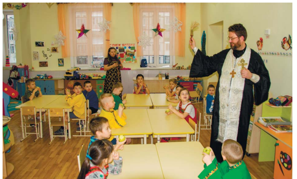
Окропление святой водой воспитанников детского сада «Семицветик»