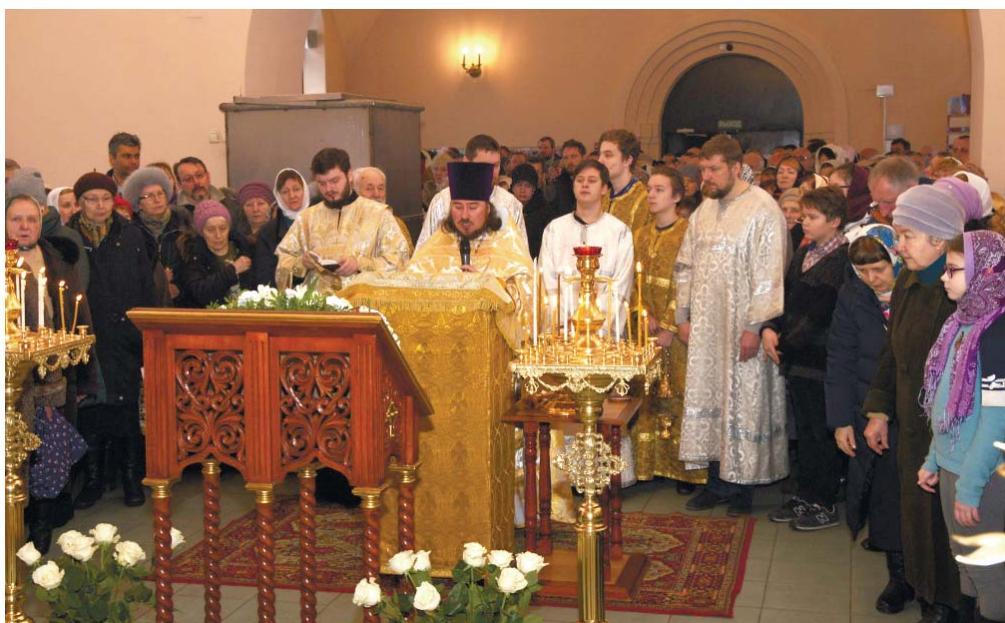
Молебное пение в Георгиевском храме города Дедовска

«В день Богоявления Господня в хирургическом отделении Центральной Истринской больницы был совершён чин Великого освящения воды»