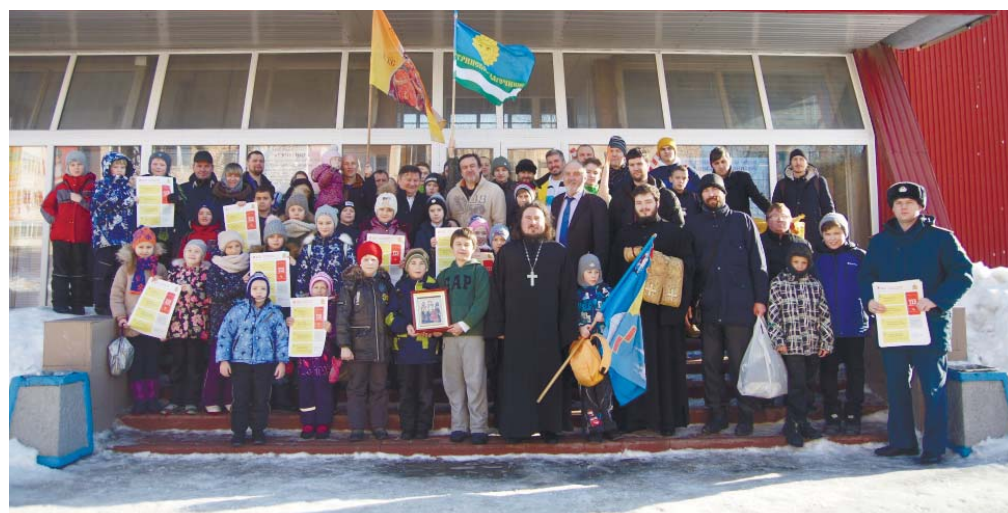
Участники спортивного праздника в Дедовске