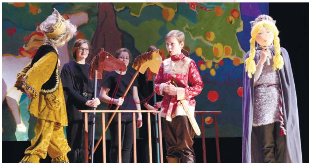
Спектакль «Иван Царевич и Серый Волк»