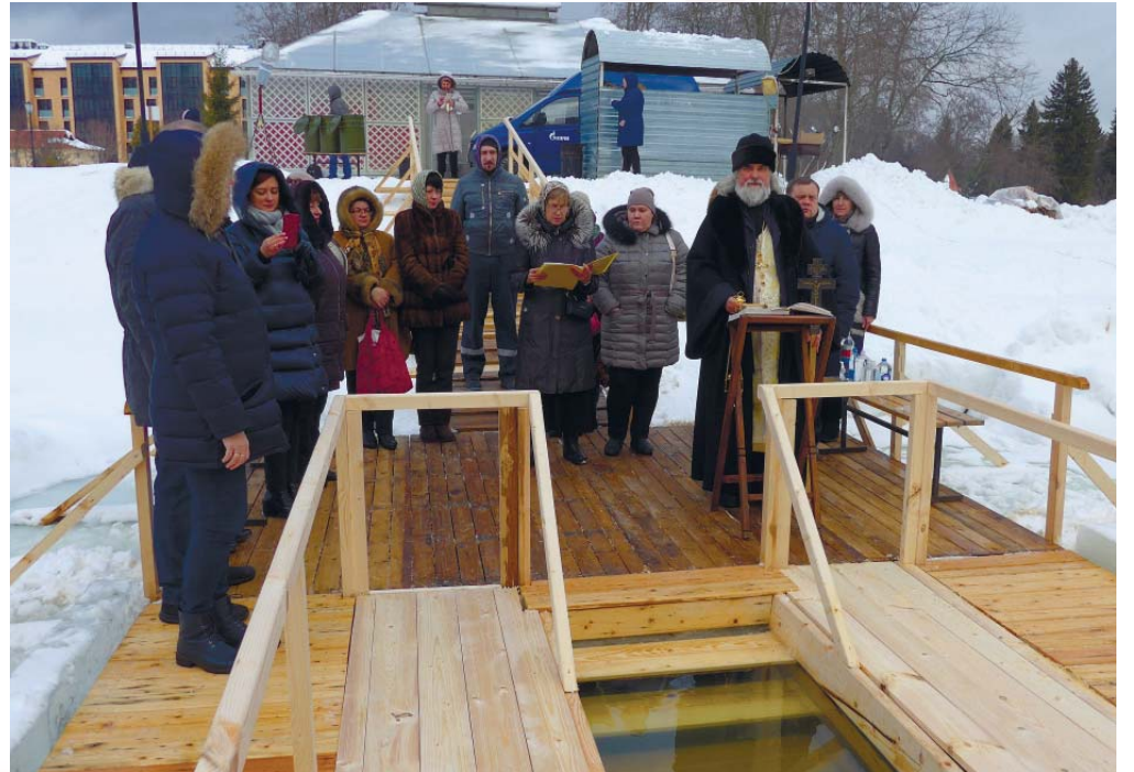
Водосвятный молебен в пансионате «Союз»