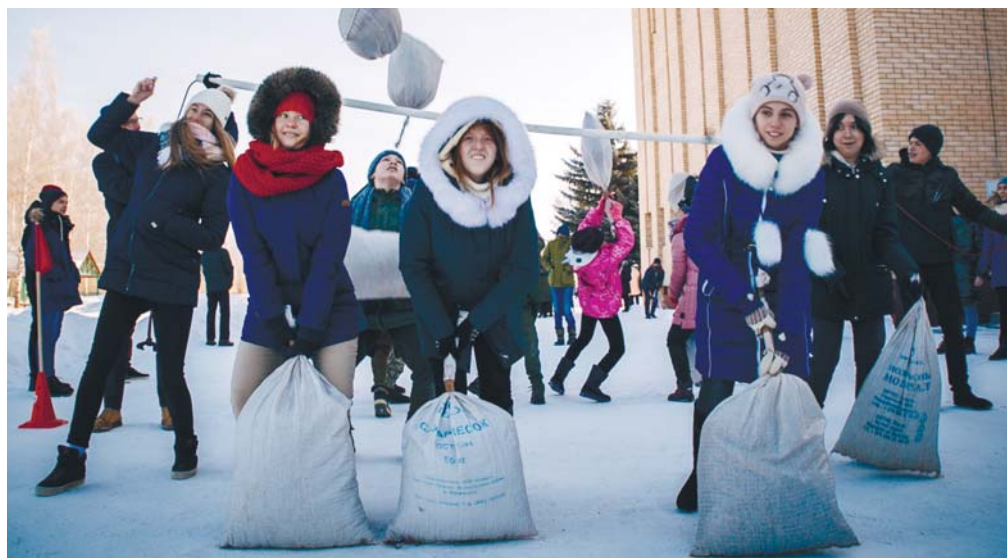
Зимние игры и забавы в лёгкий январский мороз

Была проделана огромная работа организаторов. Даже физически всех собрать под одной крышей в одно время, организовать приезд из разных областей всех участников весьма сложно. Этот момент был спланирован прекрасно. Понравилось и само место проведения. На первый, да и на последующий взгляд тоже, – очень насыщенное расписание, в котором были удачно спланированы завтраки, обеды, ужины, активные игры на свежем воздухе, мастер-классы, обсуждения, и конечно же, репетиции и просмотр спектаклей.