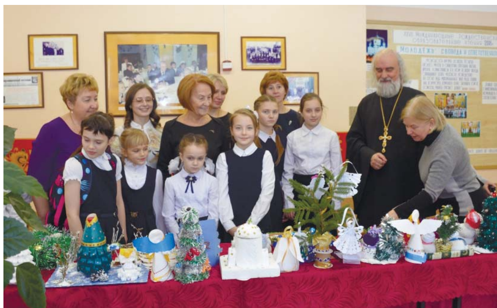
Выставка поделок к Рождеству в Костровской школе