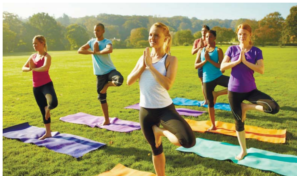
Групповые занятия йогой

Надо сказать, что йога – это чуждая нашей ментальности монашеская практика, которая вначале подразумевает отказ от противостественных желаний (греховных, порочных), затем – от естественных (брака, имущества и прочего), а потом – вообще от всех желаний. На высоких степенях «просветления», таким образом, йог отказывается от свойств своей человеческой природы, для того чтобы соединиться с «абсолютом» и стать «ничто», то