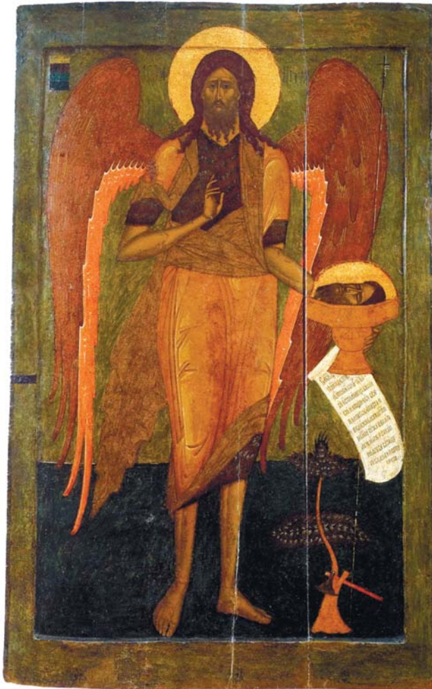
Икона «Иоанн Предтеча – Ангел пустыни» из Махрищеского монастыря. Россия. XVI век

крещение покаяния, что не соответствовало ни одному из ветхозаветных пророчеств и противоречило иудейским ожиданиям. Иоанн был удивлён и сказал: «Мне надобно креститься от Тебя, и Ты ли приходишь ко мне?» На это Спаситель ответил: «Оставь теперь, ибо так надлежит нам исполнить всякую правду» (Мф. 3:14-15). В Евангелии от Иоанна смысл Крещения Господня раскрывает Предтеча, говоря о себе, что он «для того при-