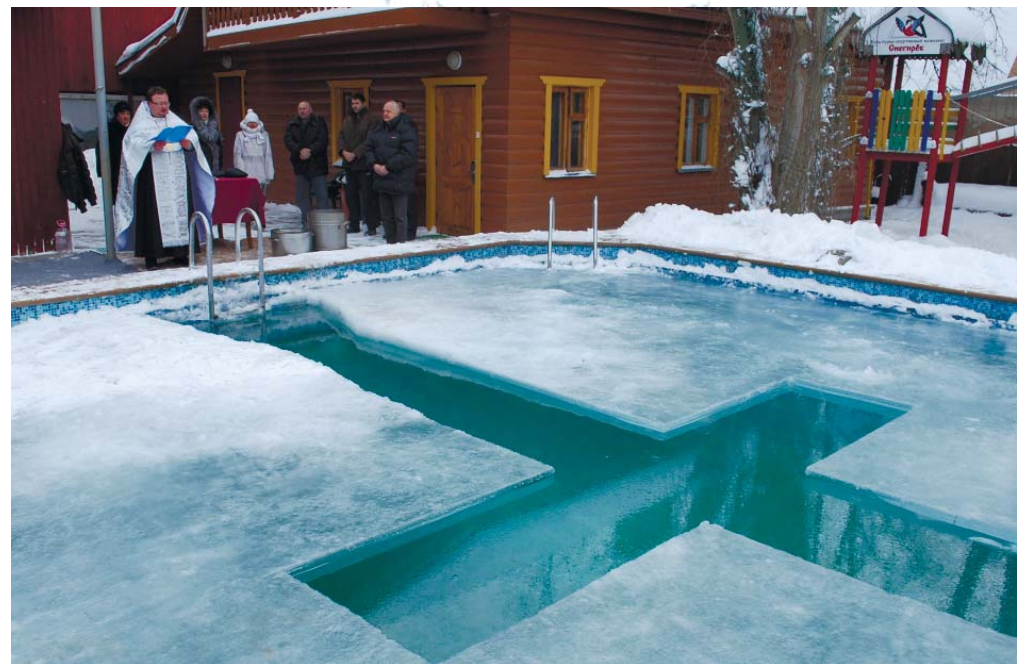
Водосвятный молебен в экотеле «Снегурёк»

топопова обучать дѣтей, воспитывающихся въ его школѣ, церковному пѣнію. Хоръ въ настоящемъ составѣ образованъ о. діаконъ очень недавно; дѣвочки привлечены къ участию въ пѣніи только съ великаго поста. Пѣніе онуфриевского хора заставляетъ еще желать очень многого; хвалить его особенно не приходится, такъ-какъ похвалы будутъ тогда незаслуженныя; но, имѣя въ виду краткость времени, употребленнаго о. Дмитриемъ на дѣло обученія пѣнію, нужно сказать, что успѣхи все-таки значительны: хоръ поетъ твердо, не сбиваясь. Удивляться надо, какъ въ такое короткое время привыкли къ церковнымъ напѣвамъ дѣвочки, раньше никогда не участвовавшія въ пѣніи. Видно, что не мало потрудился учитель; честь и ученицамъ, объ исправности и прилежаніи которыхъ мы слышали от о. діакона самые лестные отзывы. О. діаконъ сообщилъ намъ о своемъ намѣреніи привлечь къ участию въ церковномъ пѣніи и весь народъ. Нельзя не пожелать ему успѣха въ его намѣреніи неослабной энергіи въ достиженіи столь почтенной цѣли. Думаемъ, что не малымъ поощреніемъ для о. Протопопова будетъ то сочувствіе прихожанъ, съ которымъ относятся они къ участию дѣтей своихъ чтеніемъ и пѣніемъ въ Богослуженіи. Крестыяне, какъ намъ передавали, съ большею охотою посѣщаютъ теперь храмъ Божій. Пожелаемъ, чтобы примѣръ о. Дмитрія Протопопова, радѣющаго о благолѣпії церковной службы, не остался безъ подражателей. Петръ С-въ.