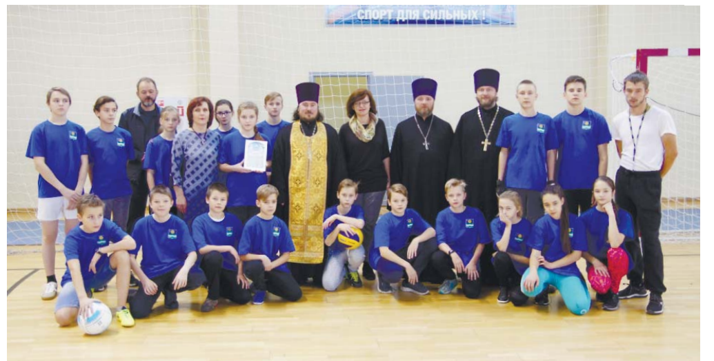
Команда православной школы «Рождество»