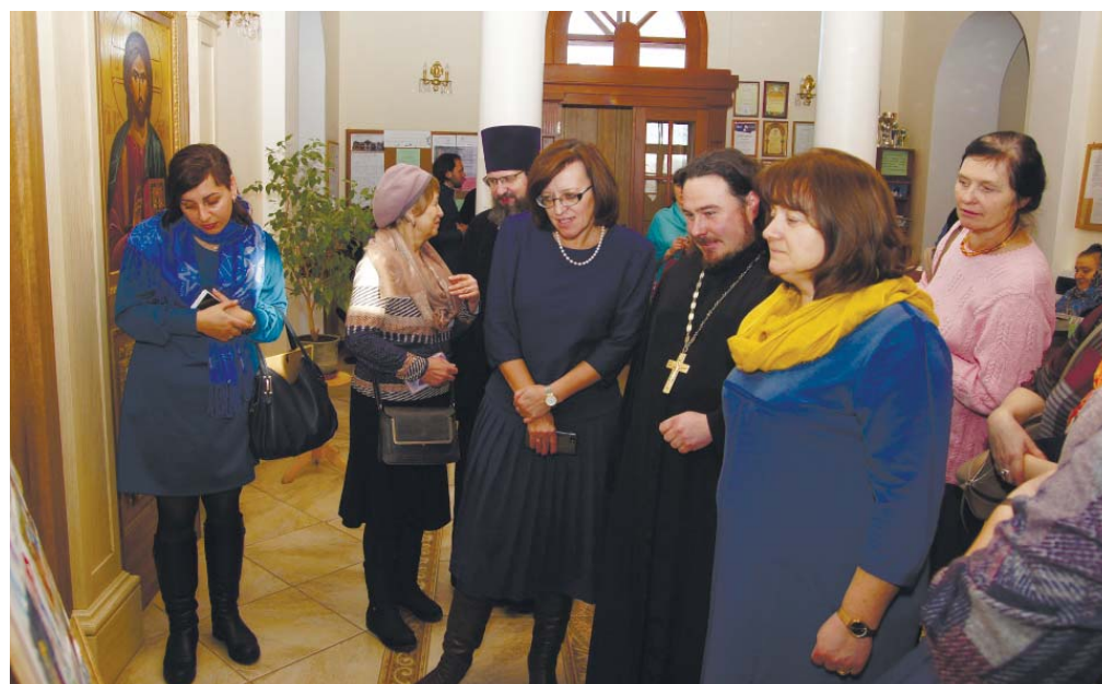
Гости на выставке рисунков в православной школе «Рождество»