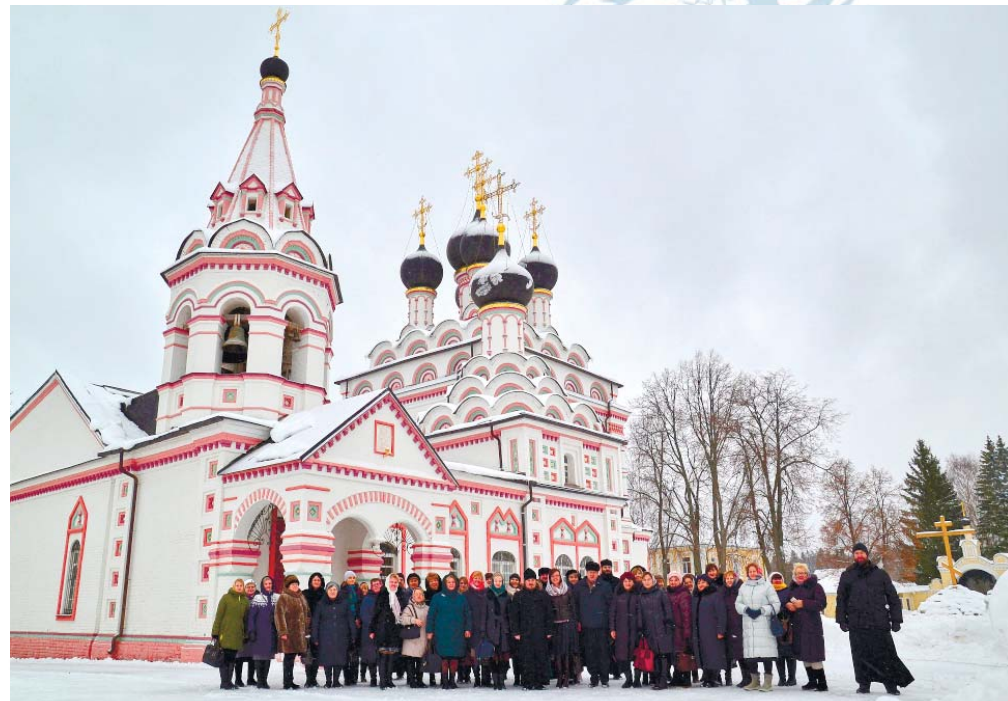
Паломники в Троицком Александро-Невском монастыре

вомученицы, которые подвизались в акатовском монастыре. Паломников встретили монахини монастыря, провели подробную экскурсию и пообщались с гостями. По