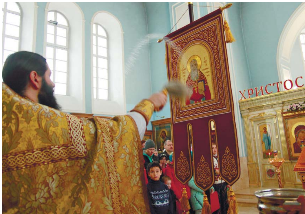
Освящение хоругви в Казанском храме села Глебово