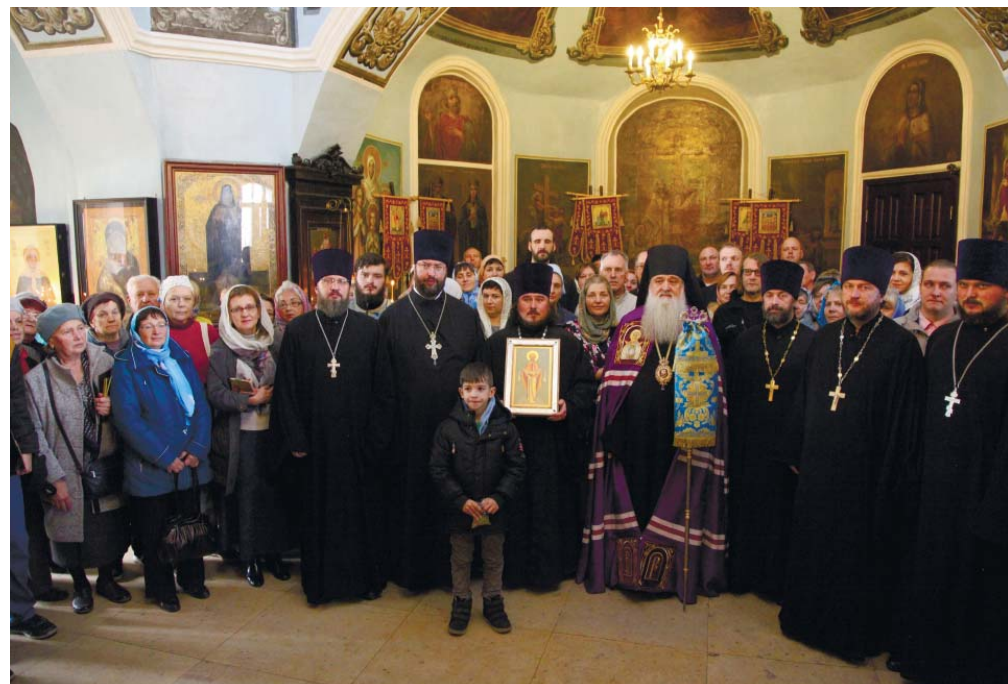
Общая фотография на память