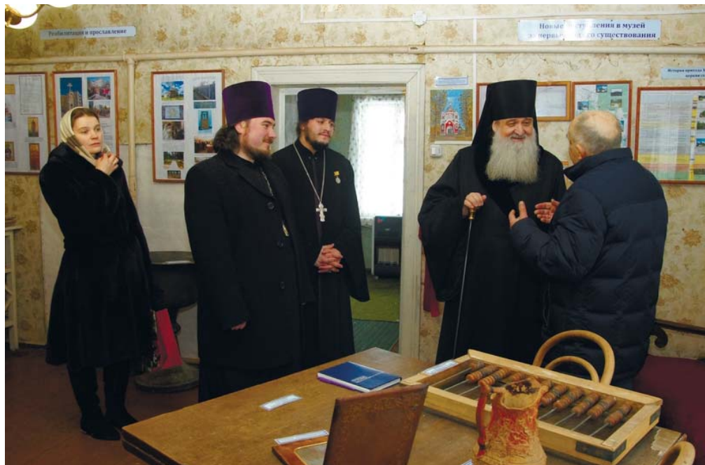
Экскурсия в Доме-музее священномученика Алексея Смирнова