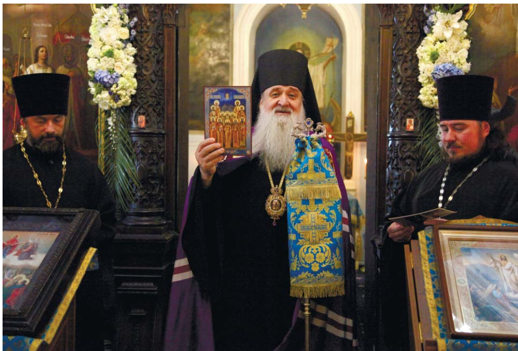
Преподнесение памятных икон после литургии

В 1928 году Никольская часовня была закрыта и стала использоваться как хозяйственное помещение, постепенно ветшая и разрушаясь. С 2012 года Никольскую часовню окормляет приход Покровского храма посёлка Пионерский. В 2017 году начались работы по восстановлению часовни.