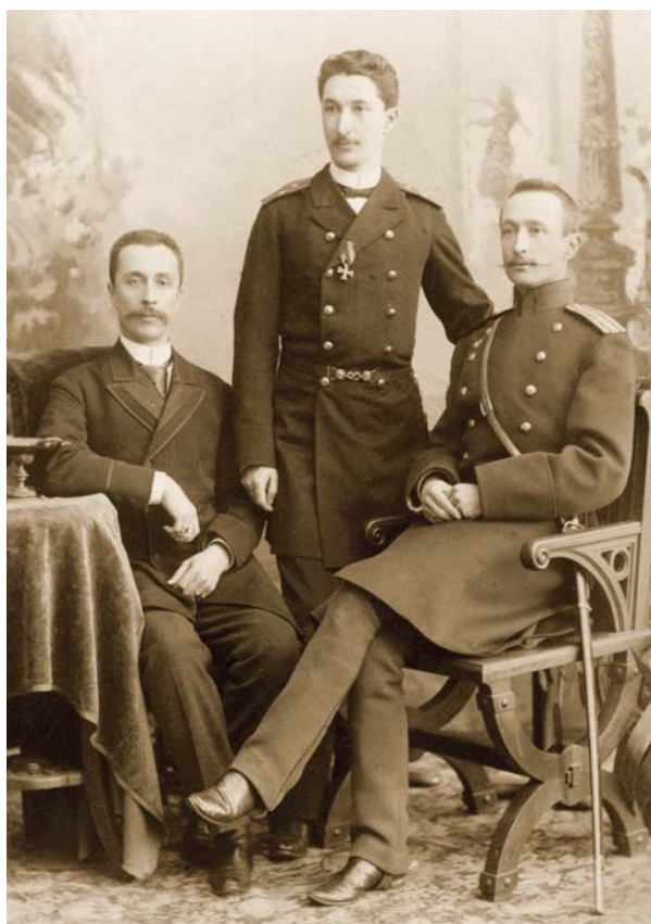
Братья Борис, Лев и Алексей Брусиловы (слева направо). 1890 год

сделанного в городе Николаеве в 1890 году, взят единственный качественный портрет Бориса Брусилова, помещённый в издании и на памятной доске в Глебове.