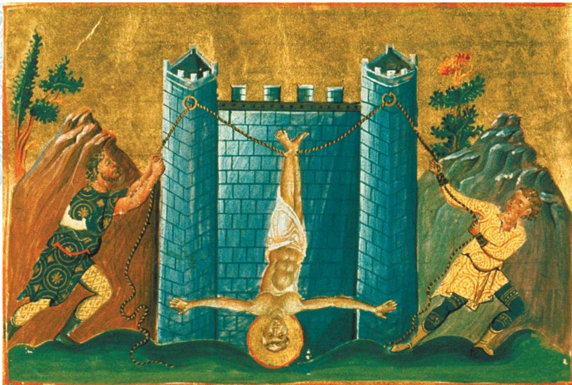
Апостол Филипп. Миниатюра Миналогия Василия II. Константинополь. 985 год

Сущность поста выражена в церковном песнопении: «Постясь от брашен, душа моя, а от страстей не очищаясь, напрасно радуешься неядению, ибо если нет в тебе стремления к исправлению, то возненавидена будешь от Бога, как лживая, и уподобишься злым демонам, никогда не ядущим». Иными словами, главное в посте – не качество пищи, а борьба со страстями.