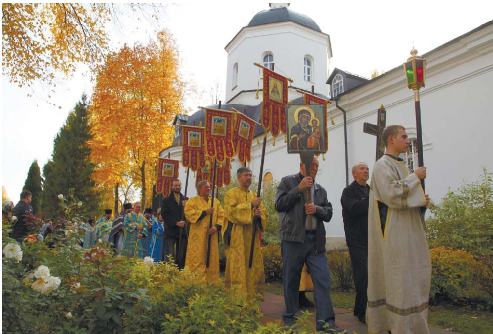
Крестный ход вокруг Покровского храма