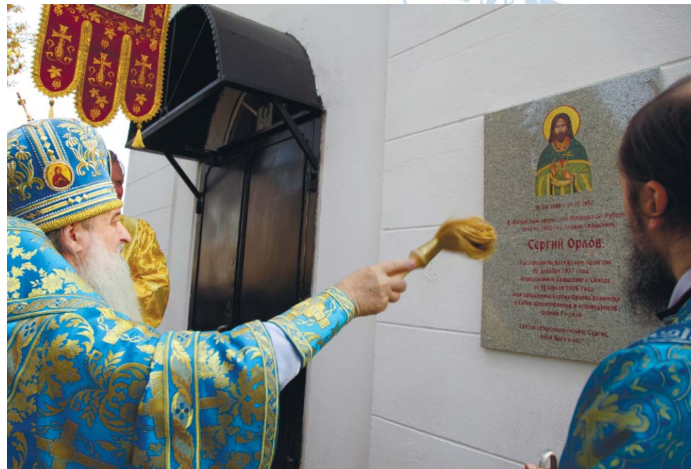
Освящение памятной доски священномученику

14 октября в Покровском храме села Покровское-Рубцово (посёлок Пионерский) городского округа Истра прошли торжества, посвящённые 270-летию со дня основания Покровского храма, 130-летию со дня рождения священномученика Сергия Орлова и Собору новомучеников и исповедников Истринской земли.