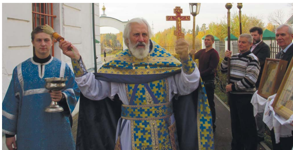
Крестный ход вокруг Покровского храма

2008 года, в возрождённый и восстановленный храм по благословению правящего архиерея митрополита Ювеналия прибыл архиепископ Можайский Григорий. Великое освящение архиепископ Григорий совершил в сослужении благочинного Истринского церковного округа протоиерея Димитрия Подорванова, благочинного Видновского церковного округа протоиерея Михаила Егорова и клириков Истринского благочиния. С любовью к почившему теперь владыке Григорию собравшиеся совершили краткую поминальную литию.