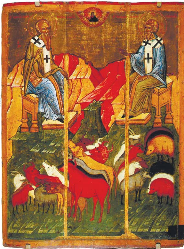
Святители Власий и Спиридон. Новгород. XV век

великих христианских подвижников? В совершенном исполнении евангельской заповеди любви, которое мы видим во всех таинственных деяниях чудотворца, заключена загадка его «вселенского» почитания. Святитель Спиридон был епископом одной небольшой и не особо выдающейся островной провинции. Он жил много лет спустя после апостолов, знавших или видевших Христа, он не стал мучеником наподобие тех, кто жизнью заплатил за веру. Он не был среди тех иерархов Церкви, кто имел мужество возглавлять христиан целых регионов в самое опасное для них время. Однако слава святителя Спиридона была так велика, что его почитание началось ещё при его жизни. Как повествует житие, родился он в конце III века на острове Кипр в семье просто-